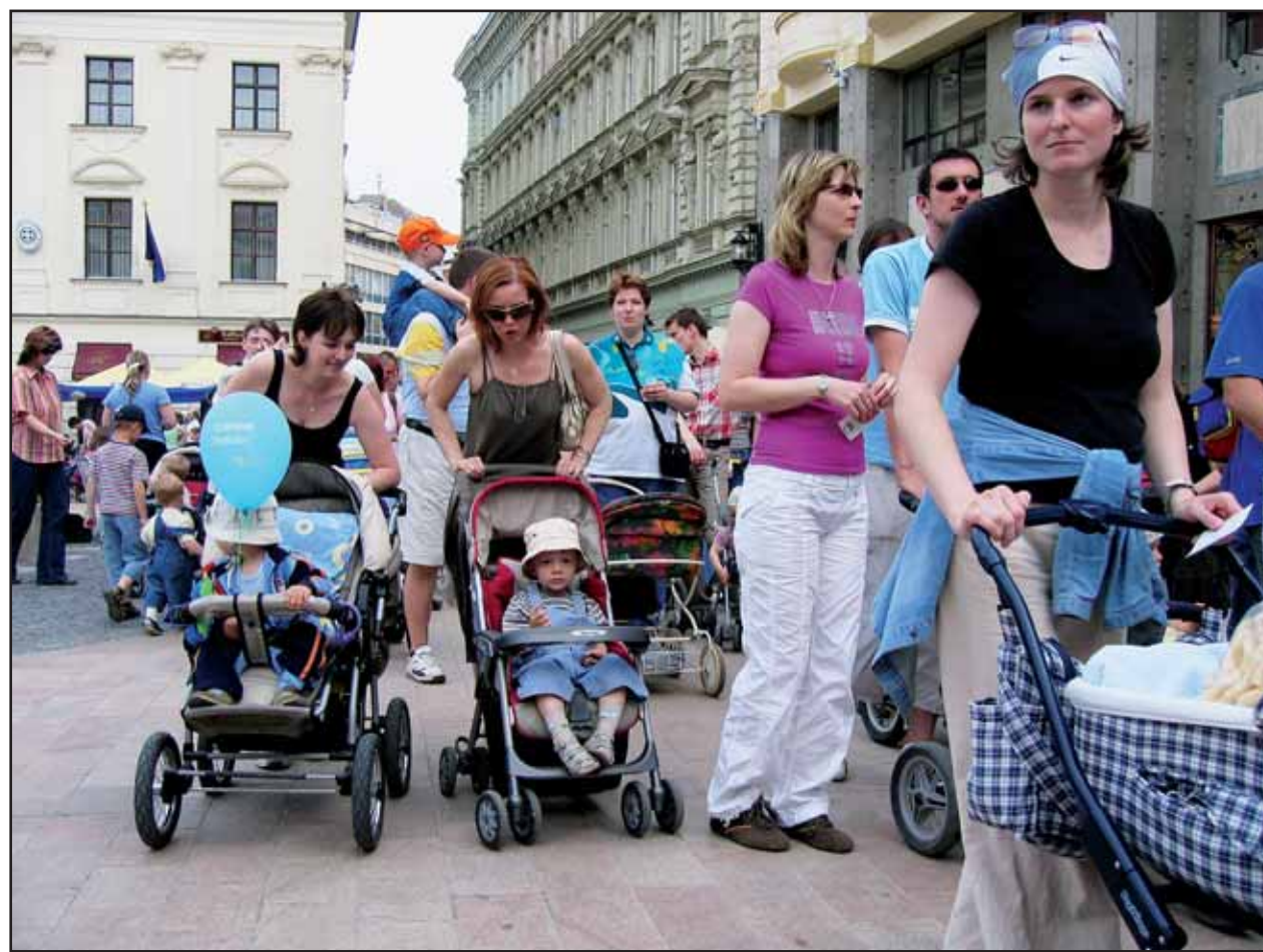
V Bratislave sa tento rok do pokusu o prekonanie rekordu zapojilo rekordných 501 kočíkov.