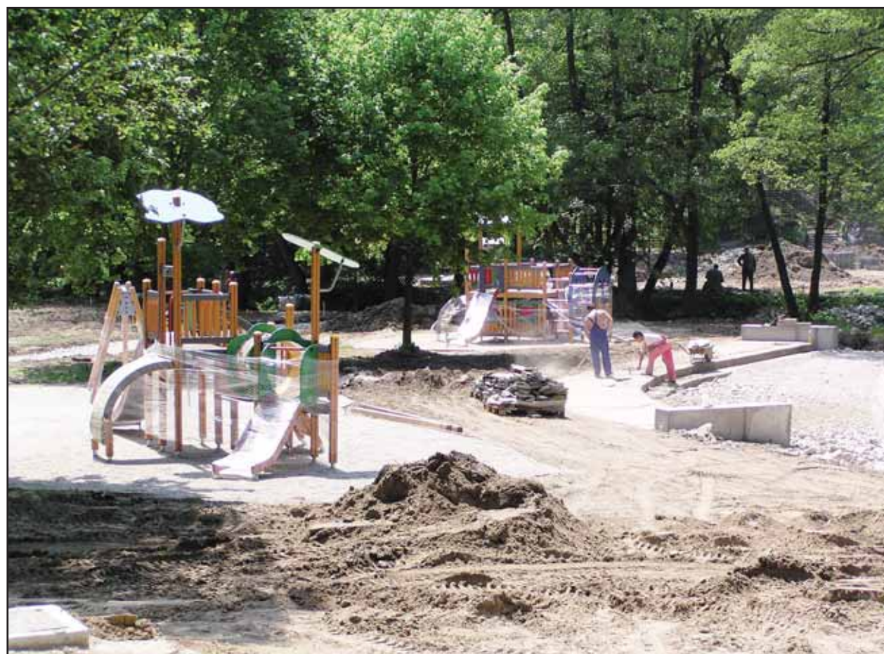
Kvôli dlhej a tuhej zime sa termín ukončenia areálu na Železnej studienke posunul na začiatok júla.