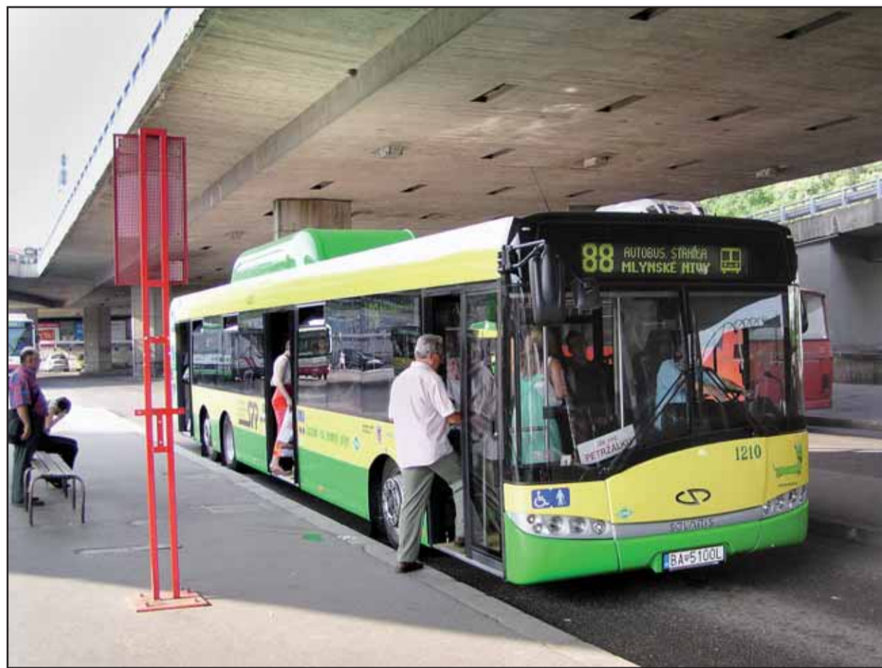
Nové autobusy Solaris Urbino sú ohľaduplné k životnému prostrediu.

Architektonický návrh na rekonštrukciu týchto verejných priestranstiev dôsledne rieši bezbariérovosť a rozšírenie peších plôch. Prepojenie peších zón na Obchodnej ulici s pešou zónou v historickom centre, ale aj nové prepojenie Župného námestia so Zámockou ulicou zatriktívni túto časť mesta, donedávna využívanú na parkovanie vozidiel. Zároveň vznikne možnosť vytvorenia novej trasy pre turistické skupiny mieriace na Hrad. Magistrát túto stavbu vzhľadom na očakávaný prínos pre zdravotne postihnutých občanov prihlásil do celoslovenskej súťaže Slovensko bez bariér. (juh)