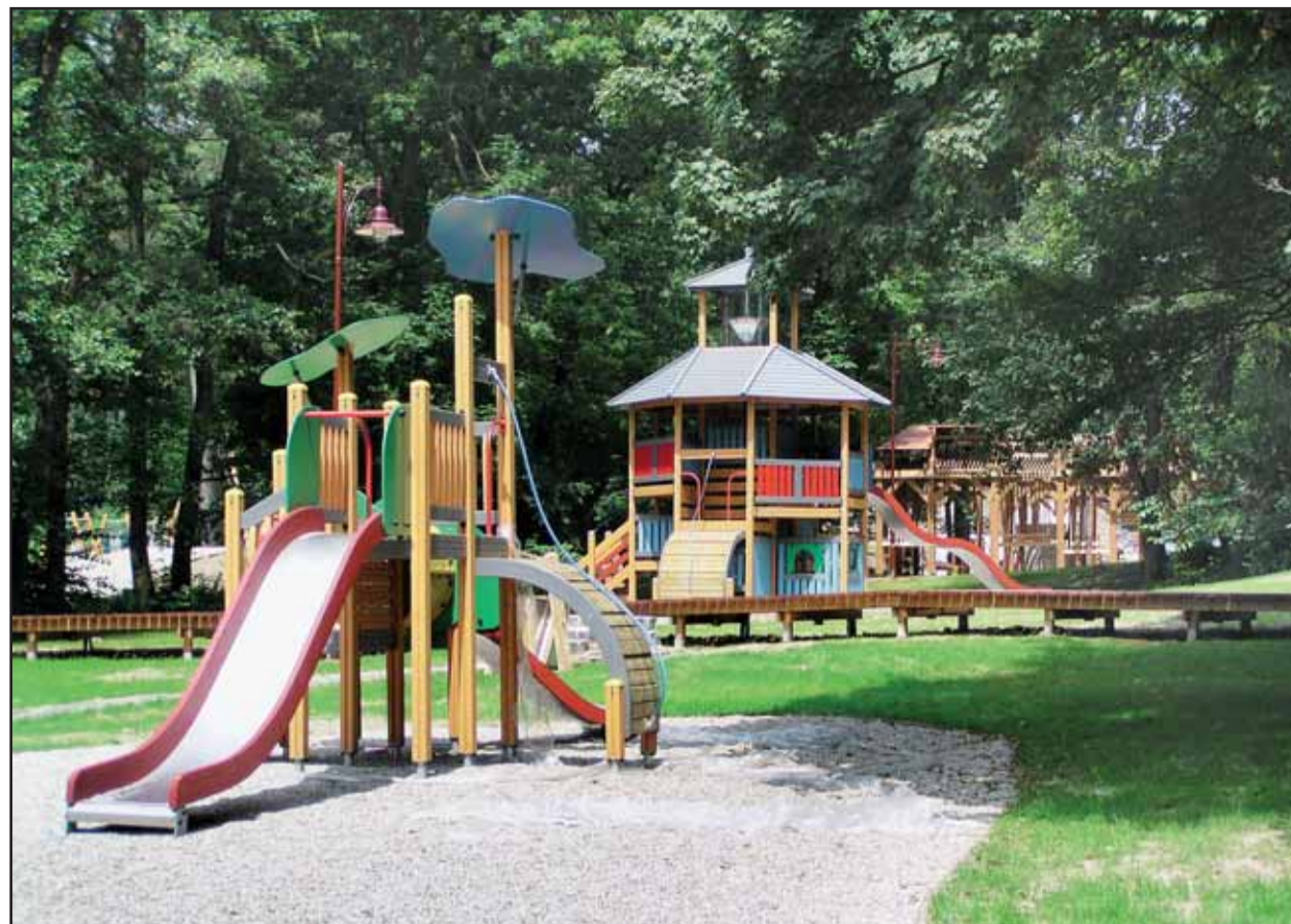
Vynovený areál na Partizánskej lúke by sa mal stať skutočnou oázou pokoja a oddychu.