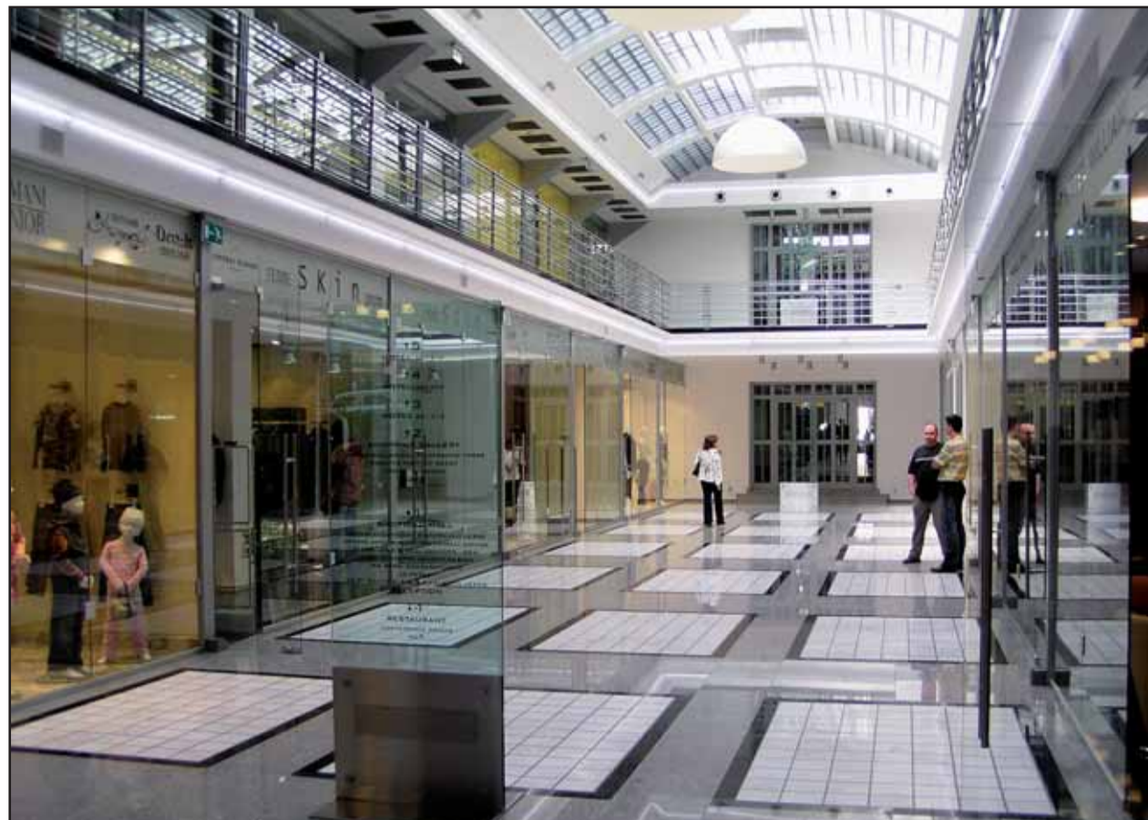
Obnovená Central Passage po rokoch chátrania je opäť prístupná verejnosti - zmenila sa na obchodnú pasáž s ponukou luxusného značkového tovaru, nechýba reštaurácia a štvorhviezdičkový hotel.

Predpokladaný termín začatia: cca 03/2007 Predpokladaný termín ukončenia: cca 03/2010