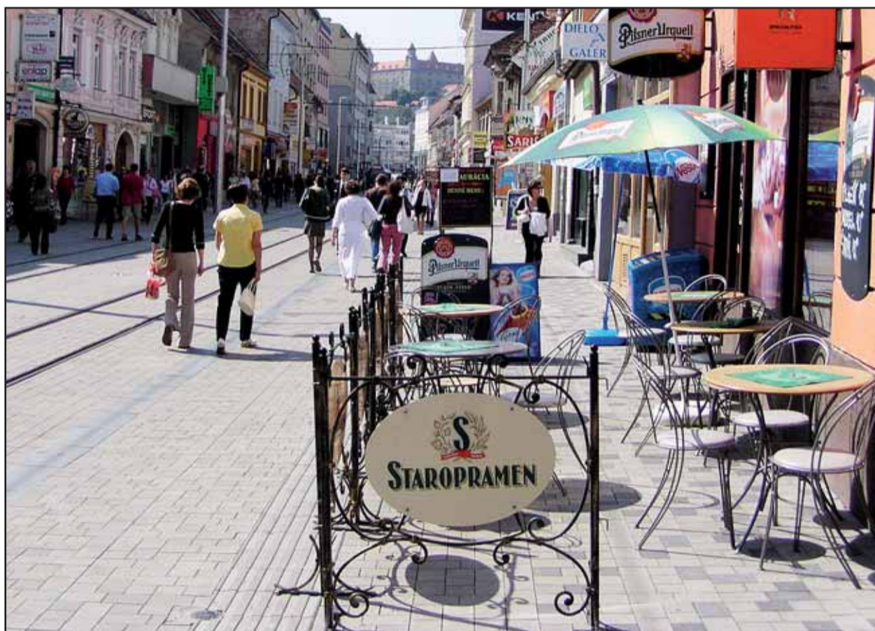
Novovydlažená Obchodná ulica má podľa predstaviteľov mesta slúžiť ako pešia zóna, chýbať nemajú ani uličné sedenia. Chodci môžu využívať ulicu v celej šírke, na prichádzajúce električky ich upozorní svetlo v dlažbe.