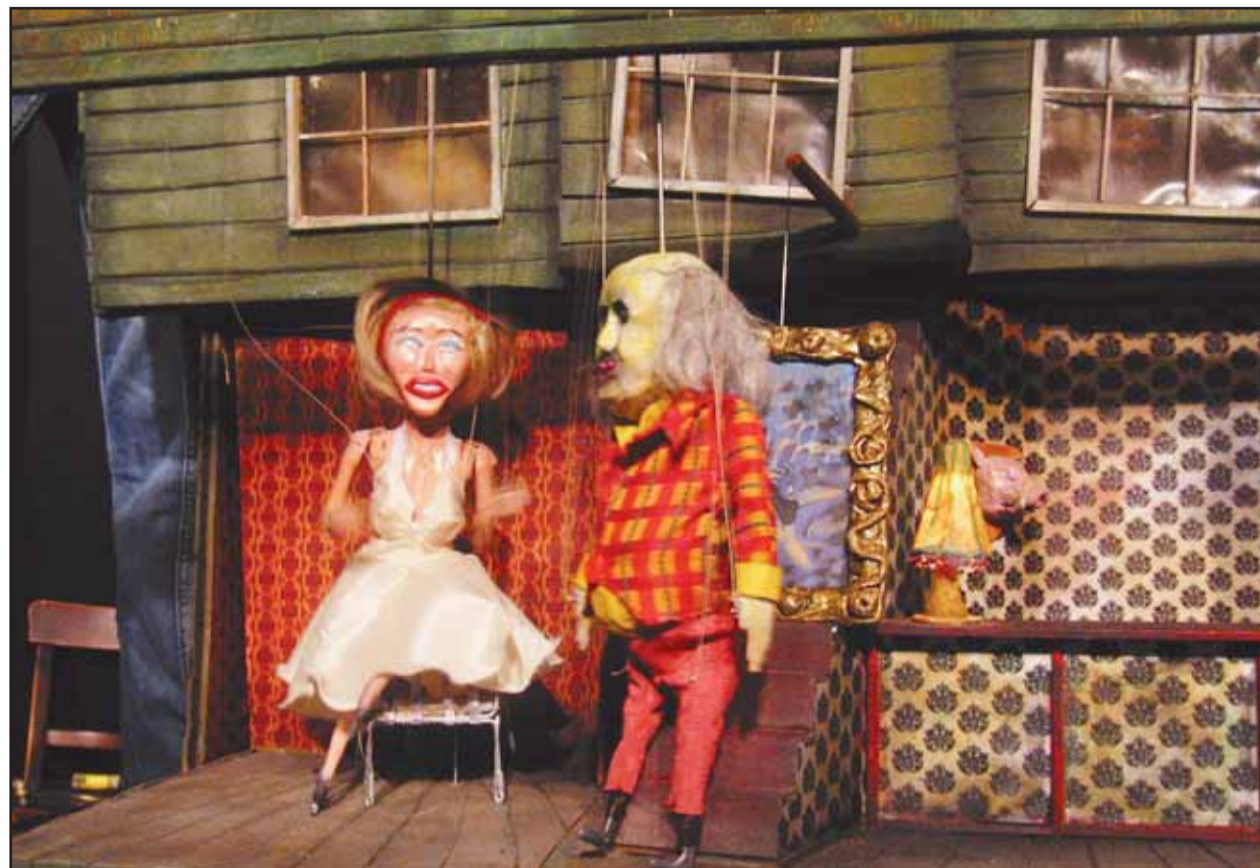
Desperanduľa je hororová šou, ktorá však detského diváka určite nevystraší.

Pri vystúpení maďarského projektu Yonderboi and Kings Of Oblivion nepochybne pookreje srdce nejedného fanúšika inteligentnej elektroniky. Poľskí Bikiniinspector and Squal urobia bodku za prvým dňom festivalu. A pred poslucháčmi a divákmi festivalu Nu Jazz Dayz bude ešte jeden celý deň a noc... (dš)