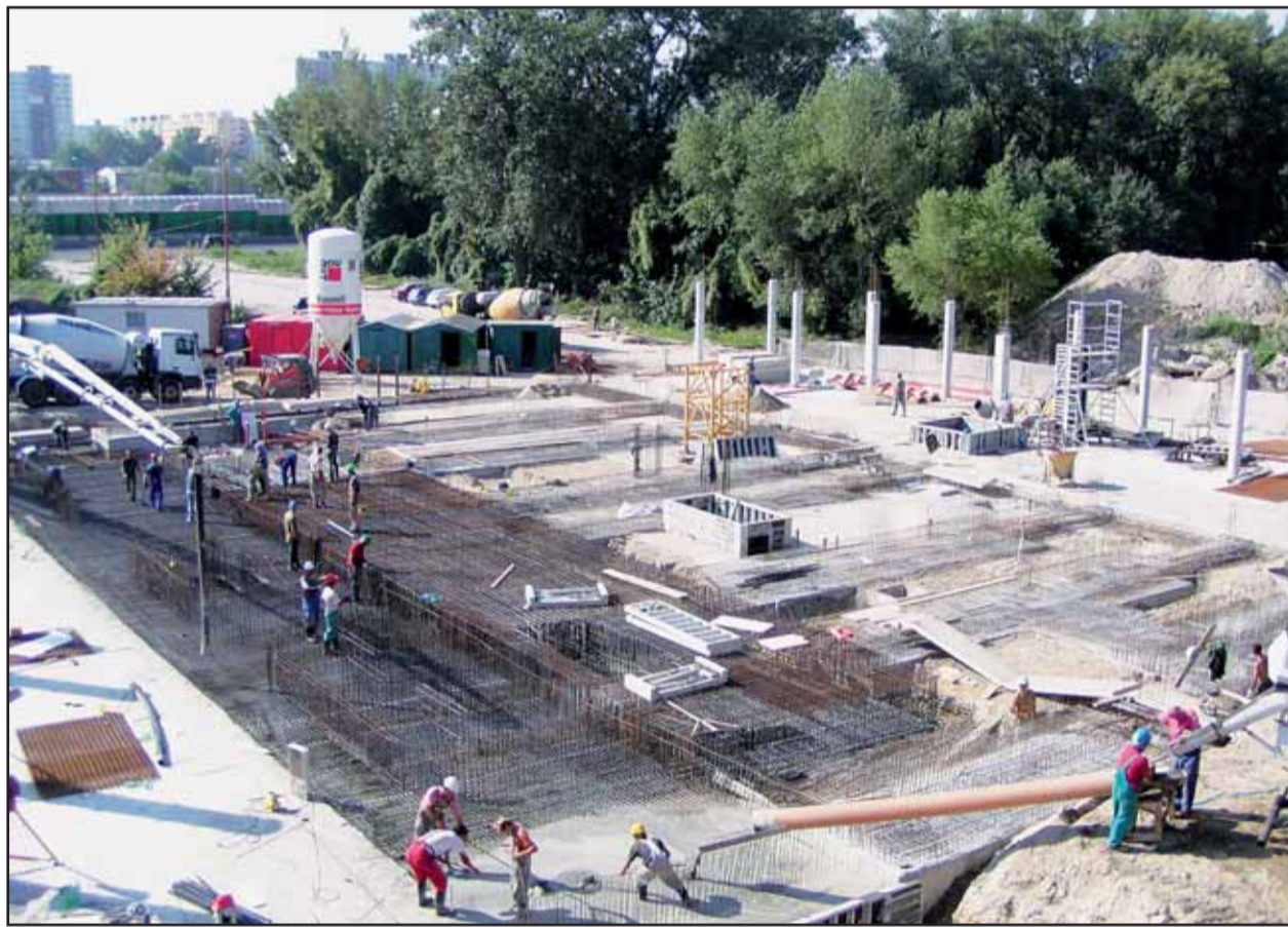
Na Krasovského ulici sa začala výstavba nového polyfunkčného domu, v ktorého susedstve majú vyrásť aj ďalšie budovy. Ich výstavba by znamenala zánik príľahlého lesíka, za záchranu ktorého bojujú ochranári.

Ako sme už informovali, okrem 18-podlažného domu, ktorý sa už stavia, má v jeho blízkosti na území pozdĺž Einsteinovej ulice - aj na mieste lesíka, za zachovanie ktorého bojujú ochrancovia prírody - vyrásť ešte jeden polyfunkčný dom, dva hotely a obchodné centrum. Spolu majú vytvoriť nové polyfunkčné centrum, ktoré má podľa predstáv investorov prispieť k ďalšej urbanizácii severnej strany Einsteinovej ulice. (juh)