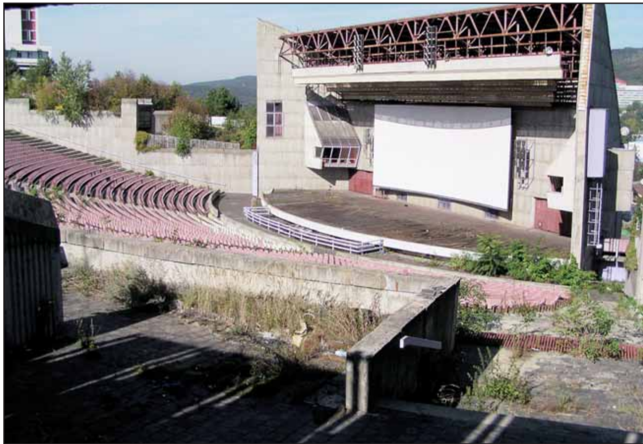
Posledné kultúrne podujatie bolo v amfiteátri vlani v septembri. Odvtedy objekt pustne...