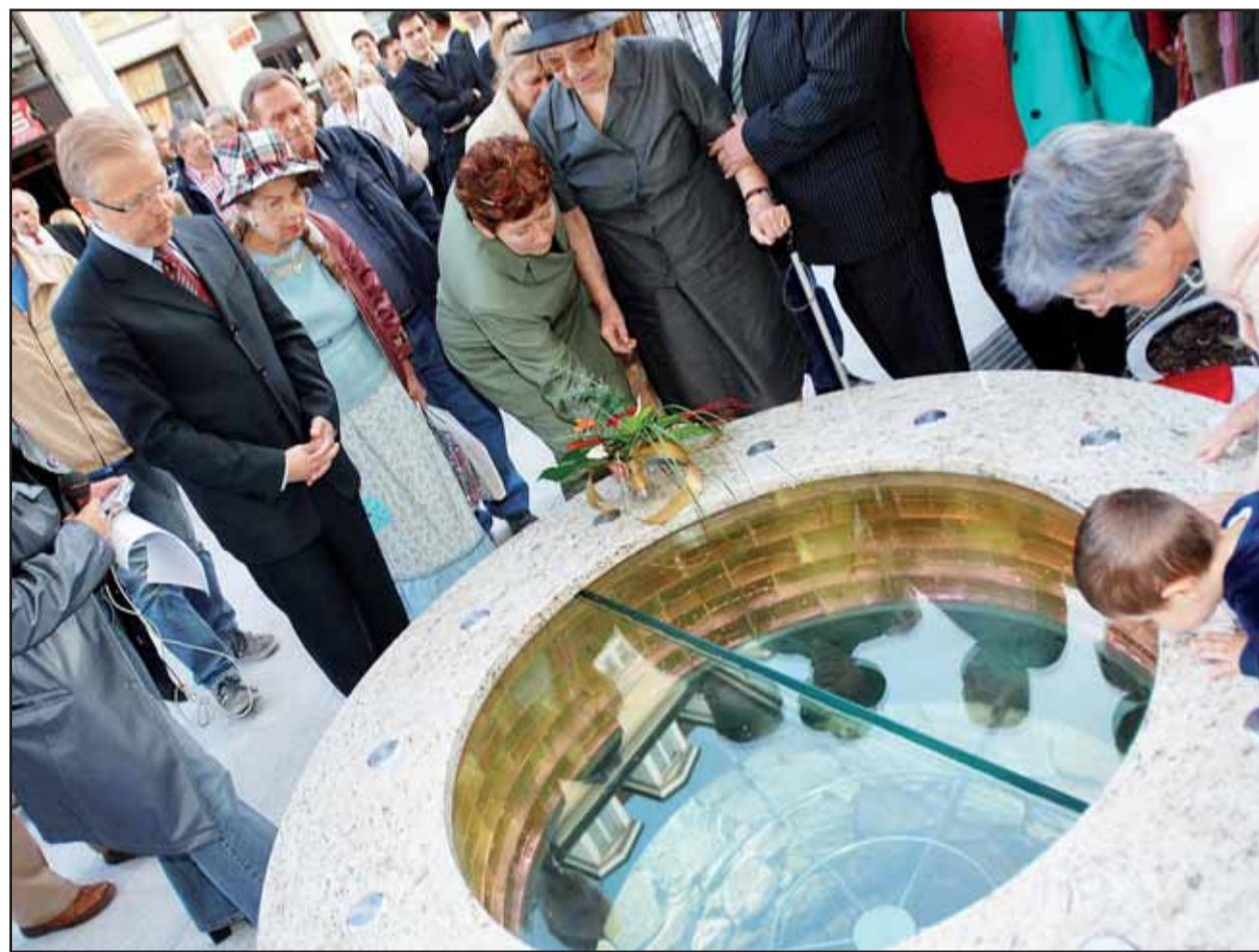
Na slávnostnom odhalení studne bola aj dcéra jedného z mužov, ktorí tu pred 80 rokmi zahynuli.

Osobitným problémom je nástup žiakov a študentov na začiatok vyučovania v jednotlivých školách. V súčasnosti je v celej Bratislave jednotný čas začiatku školského vyučovania - o 8.00 h. Pol až trištvrté hodiny pred začiatkom školského vyučovania je dopravná špička mimoriadne ostrá. Analýzy dopravného podniku naznačujú, že rozloženie začiatkov školského vyučovania by prinieslo aj skvalitnenie nielen MHD, ale aj celkovej dopravy na území mesta - stačil by posun začiatku vyučovania o 15 minút aspoň na stredných školách. (juh)