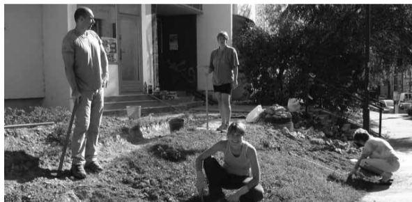
Krajšie je aj na ul. Hany Meličkovej na Dlhých Dieloch.

Vďaka Sídliskovému programu Komunitnej nadácie Bratislava bolo z fondu Slovenskej sporiteľne založeného v nadácii rozdelených 300 000 Sk medzi mnohých aktívnych ľudí a ich susedov.