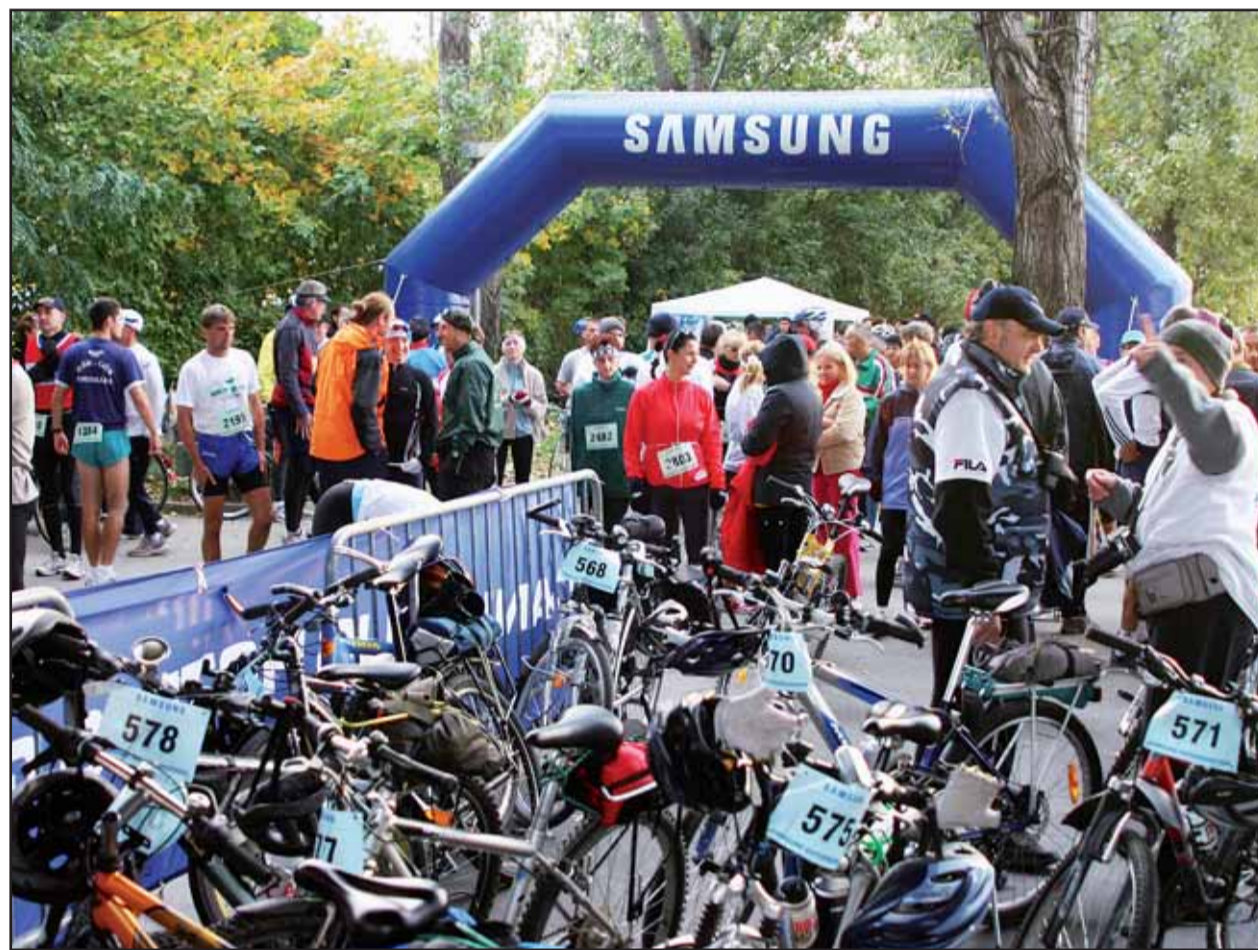
Ciel' a štart Supermaratónu bol v Bratislave na nábrežnej promenáde pod Mostom Lafranconi.

Okrem chronických problémov má doprava aj opakované problémy. Akútnym je vodorovné značenie. Správcovia komunikácií majú najvyšší čas dať ich opraviť a obnoviť. Gustav Bartovic