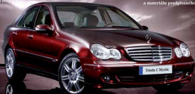
Foto: preverovanie Mystic

* Do 160 000 km vrátane práce a materiálu predpísaného výrobcom.