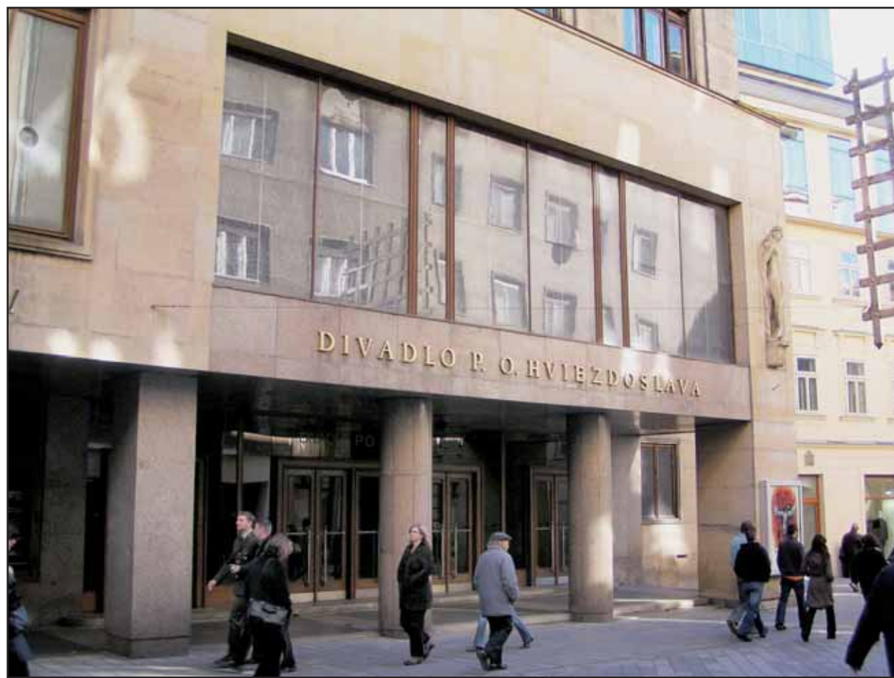
Divadlo P. O. Hviezdoslava možno bude čoskoro spravovať nový vlastník - mesto Bratislava.