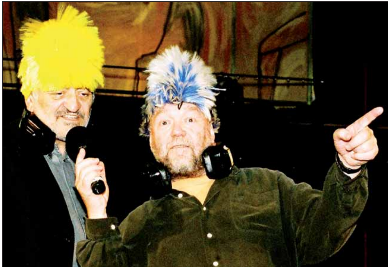
Hlavní protagonisty divadelného predstavenia Lipa spieva Lasicu.