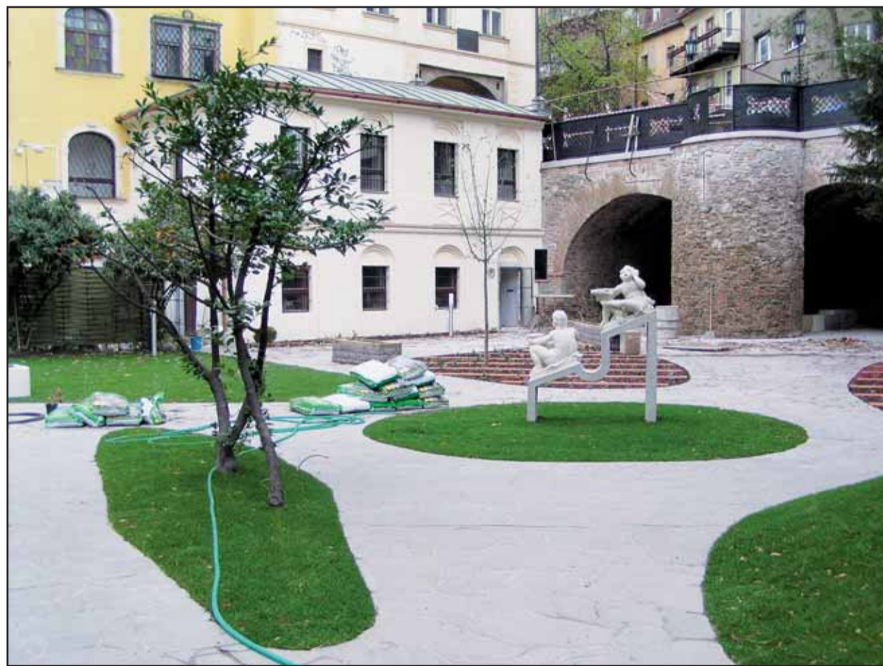
Posledné záhradné úpravy pred otvorením Letnej čítárne v Michalskej priekope.

Sochu by mali opraviť špecialisti z Katedry zvráňania Materiálovo technologickej fakulty v Trnave, ktorí už majú s jej opravou skúsenosti. Schöner Náciho totiž poškodili aj 22. mája tohto roka nadranom anglicky hovoriaci turisti a predtým v auguste 2004, keď do nej narazilo zásobovacie nákladné auto. Ani v jednom prípade sa páchatel'ov nepodarilo odhaliť. (rob)