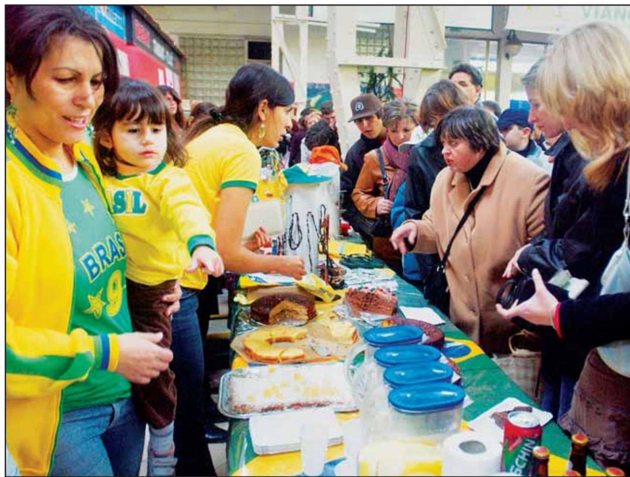
Na Vianočnom bazári boli ľudia z tridsiatich krajín sveta, vrátane Brazílie.

Pripomeňme, že voľby primátora mesta a starostov mestských častí, mestských a miestnych poslancov budú v sobotu 2. decembra od 7.00 do 20.00 h . Kompletný zoznam všetkých kandidátov pre komunálne voľby v Bratislave nájdete na www.bratislavskenoviny.sk , kde je možné o jednotlivých zoznamoch kandidátov aj diskutovať. (brn)