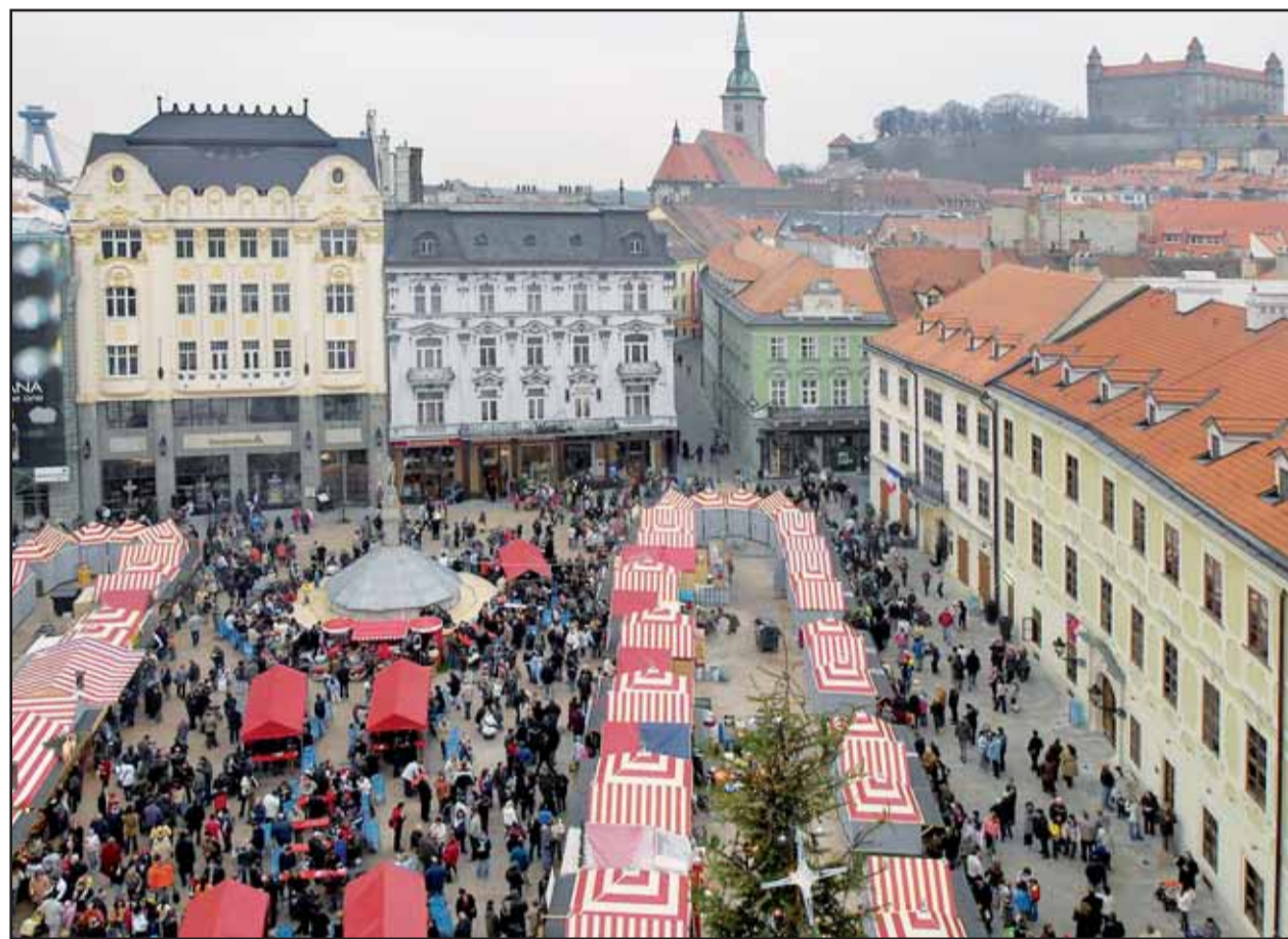
Vianočné trhy lákajú Bratislavčanov nielen večer, ale cestu na Hlavné námestie si nájdu aj cez deň.

Na infolinku sa dá počas pracovných dní volať od 8.00 do 15.00 h a v deň volieb, v sobotu, od 7.00 do 20.00 h. Informačná linka je určená výlučne pre občanov a neslúži na informovanie právnických osôb, médií, politických strán a obcí. (red)