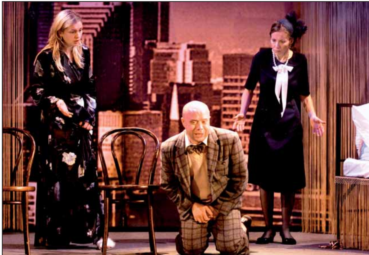
Je to bláznivá komédia o žene, ktorá klame aj keď nemusí...