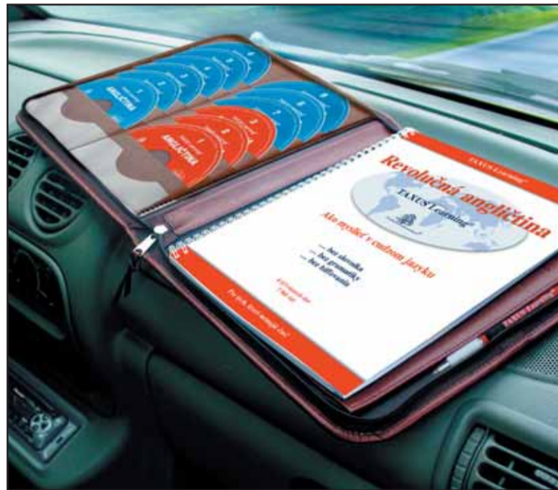
TAXUS Learning® funguje všetkým typom ľudí. Záruka kvality na CD 5 rokov! Predaj aj na splátky!

Ak sa vám zdá ničो nadsadené, potom vedzte, že iba naše „racionálne“ školstvo v nás vypestovalo poznanie, že cudzie jazyky sú ťažké. Systém výučby v škole je namáhavý, pretože tam musíte ihneď nahlas čítať, písať a biff'ovať sa slovíčka. To je priam rakovinou pre naše znalosti jazykov. Prečo? Z dvoch dôvodov. Vráťme sa k deťom. Ktorý rodič hovorí k svojim deťom jednotlivými slovami? Navyše samotné slovo znie úplne inak, ako zapojené do celých viet. Metódy TAXUS Learning® stoja 7 500 Sk, alebo dobierkou 7 620 Sk (odchádza v deň objednania) a máte ich natrvalo a navyše pre celú rodinu. Na porovnanie, jedna hodina konverzácie s lektorom stojí približne 400 Sk. Návratnosť TAXUS Learning® je asi 19 takýchto hodín. Máte málo času na učenie a chcete spoznať zlepšenú cestu učenia sa detí? Potom kontaktujte: TAXUS International, s. r. o. Riazanská 110, 831 02 Bratislava, 09-16 hod., tel.: 02 446 448 91, 0905 526 824, 0910 785 605, e-mail: taxus@taxus.sk, www.taxus.sk