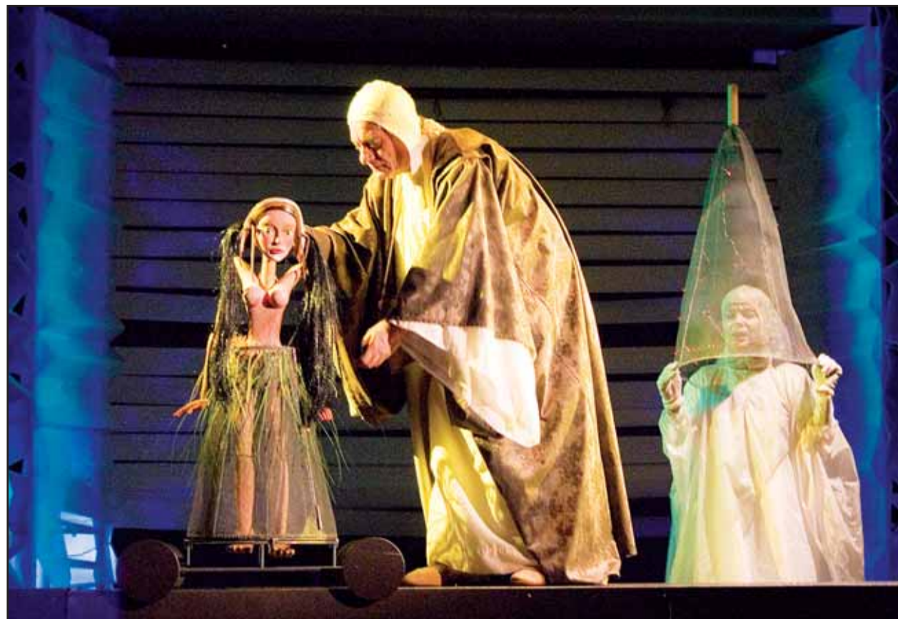
Shakespeareova Búrka otvorila novú sezónu Bratislavského bábkového divadla.