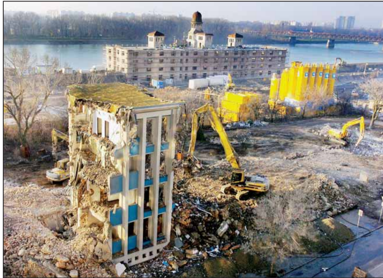
V uplynulých dňoch zbúrali Dom lodníkov, ustúpil novej výstavbe na dunajskom nábreží.

Trhy si však pýtajú viac aj od organizátorov. Sú stiesnené, večer takmer nepriechodné, treba uvažovať o zvýšení počtu stánkov a rozšírení priestoru. Treba zvýšiť počet zastrešených pultov na konzumáciu, aj keď počasie zatiaľ bolo láskavé. Treba tiež myslieť na predajcov, ktorí trávia na trhoch celé dni a sťažujú sa na rozmiestnenie a dostupnosť toaliet - potrebovali by vyhradené kabínky. Lebo každú romantiku treba podporiť, ako sa bez nostalgie vraví - logicky. (gub)