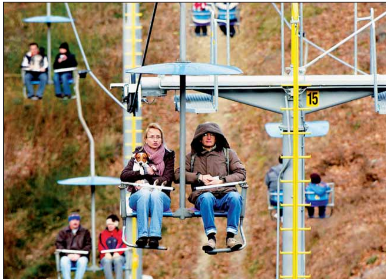
Teplý víkend mnohí Bratislavčania využili na prechádzky do prírody.