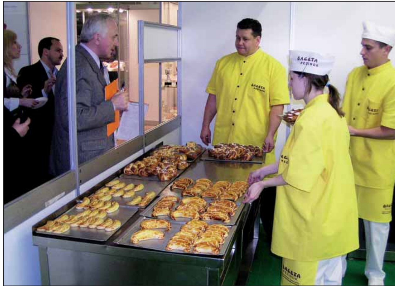
O Najlepší Bratislavský rožok premiérovo súťažilo 10 družstiev z troch krajín.

Prostriedky chce letisko kryť sčasti z vlastných zdrojov a čiastočne formou pôžičiek a lízingu. V tomto roku očakáva spoločnosť príjmy 800 miliónov korún. V budúcom roku by príjmy mali presiahnuť viac ako miliardu korún. (brn)