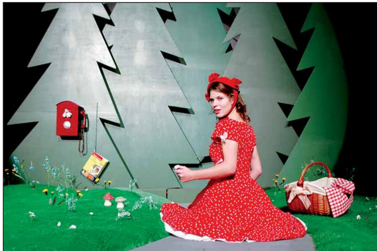
Aj v Divadle Aréna je Červená čiapočka detsky naivná a dôverčivá.

Hrôzostrašná komédia sa odohráva v roku 1838 na vidieckom sídle neďaleko mesta Neuruppin. Skvele hereckej štvorici udáva režisérské tempo Pavel Háša, s hudbou Josefa Pecha, scénou Milana Čecha a v kostýmoch Terezy Bartákovéj. Nepochybujeme o tom, že v spoločnosti výborných českých hercov sa budete báť naozaj zmysluplne. (dš)