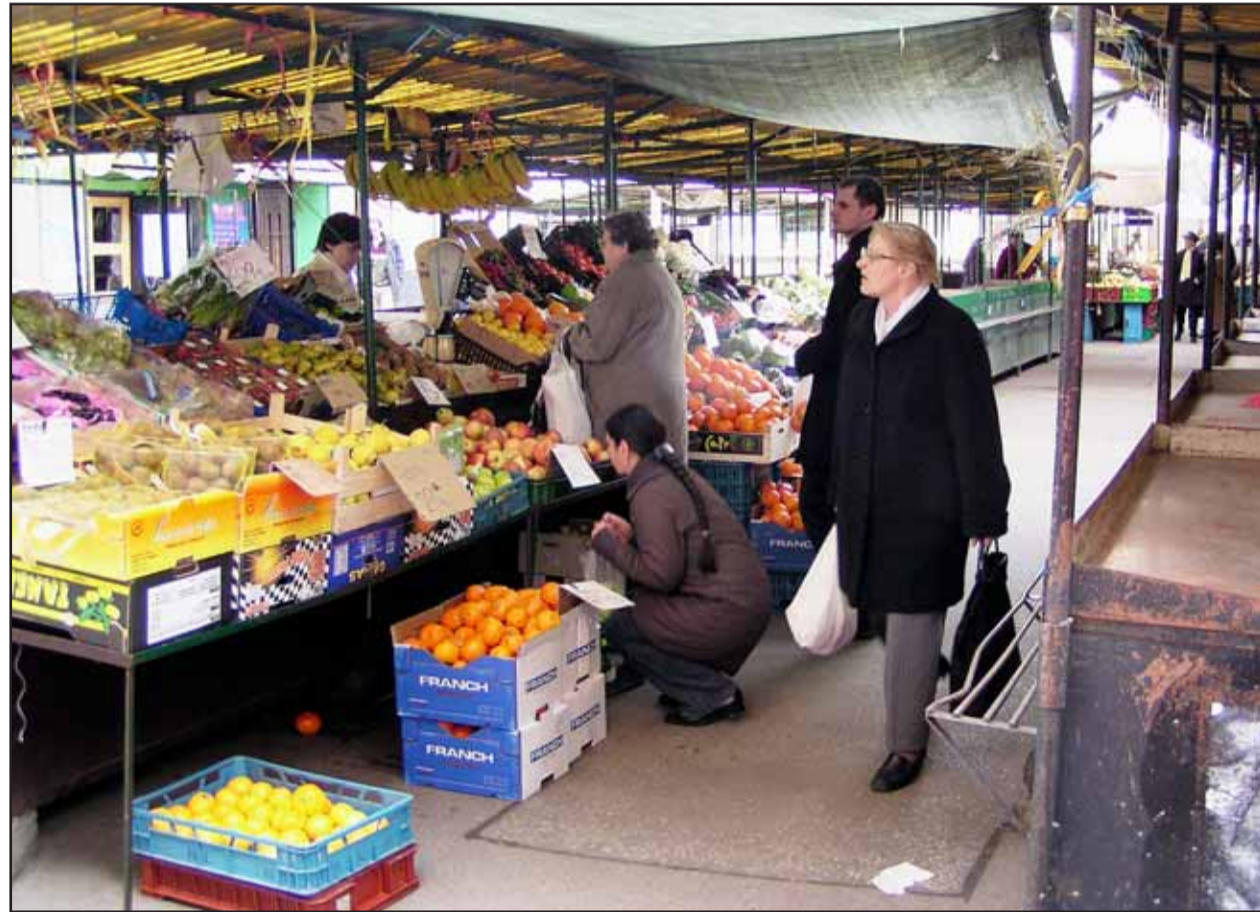
Napriek tlaku hypermarketov majú Staromešťania stále záujem nakupovať aj na trhoviskách.

Bratislavská mestská polícia však vlni aj prispela do mestskej kasy - vyrubila pokuty v celkovej sume 11,3 milióna, čo je v porovnaní s rokom 2005 viac o vyše než dva milióny. Gustav Bartovic