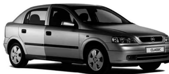
Agila za 150 000 Sk*