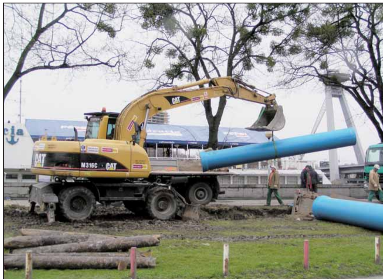
Rekonštrukcia vodovodu na Rázusovom nábreží potrvá až do augusta.

Ide o druhý odhalený prípad korupcie v bratislavskej samospráve. Prvým bol prípad bývalého starostu Rače Pavla Bielika, ktorý bol za branie úplatku odsúdený na päť rokov väzenia nepodmienečne. Rozsudok nie je právoplatný, pretože odsúdený sa proti nemu odvolal. (brn, sita)