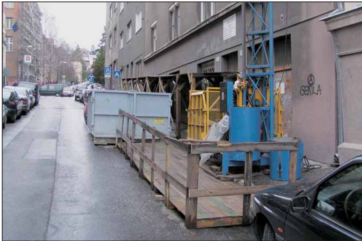
Neexistuje žiadna norma, ktorá by podľa rozsahu stavby stanovovala, akú plochu môže stavebník zabrať. O všetkom rozhoduje projektant a peniaze. A po dlhý čas chodci stavebné zariadenie obchádzajú.

Ani jedna oslovená mestská časť nelimituje, aký veľký priestor môže stavebník zabrať. Stavebné firmy, ktoré si ešte za minulého režimu osvojili, že majú také stavenisko, aké si vyžadujú, ho aj majú. Učia sa od nich aj firmy, ktoré prichádzajú z cudziny, aj keď už aj u nás sa vedľa stavitelia uskromniať. Napríklad záber vo veľmi preťaženej mestskej časti na Pribinovej nemožno porovnávať s tým, koľko zabrali stavitelia Rozadolu na rohu Ružovej doliny a Trenčianskej ulice, hoci stavby sú porovnateľnej kategórie. Aj stavitelia základov River Parku sa uskromnili, lebo sa jednoducho do priestoru medzi Dunajom a komunikáciami museli natesnať. Gustav Bartovic