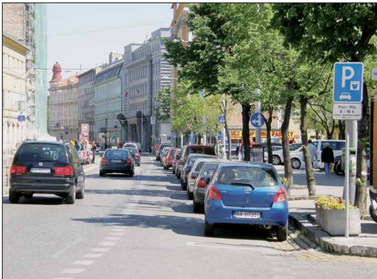
Jeden jazdný pruh na Špitálskej ulici pred budovou ministerstva práce a sociálnych vecí začal slúžiť na parkovanie. S touto zmenou organizácie dopravy súhlasil aj bratislavský magistrát.