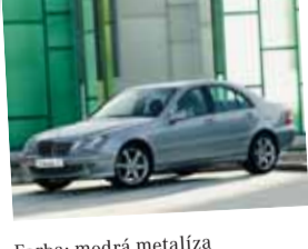
Mercedes-Benz Triedy C 200 Kompressor

Farba: modrá metalíza Interiér: čierna látka Stav km: 83 200 Rok výroby: 2003