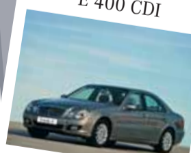
Mercedes-Benz Triedy E 400 CDI

Farba: strieborná metalíza Interiér: čierna koža/látka Stav km: 33 000 Rok výroby: 2004