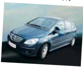
Mercedes-Benz Triedy B 180 CDI - N1

Farba: čierna Interiér: béžová látka Stav km: 5 000 Rok výroby: 2006