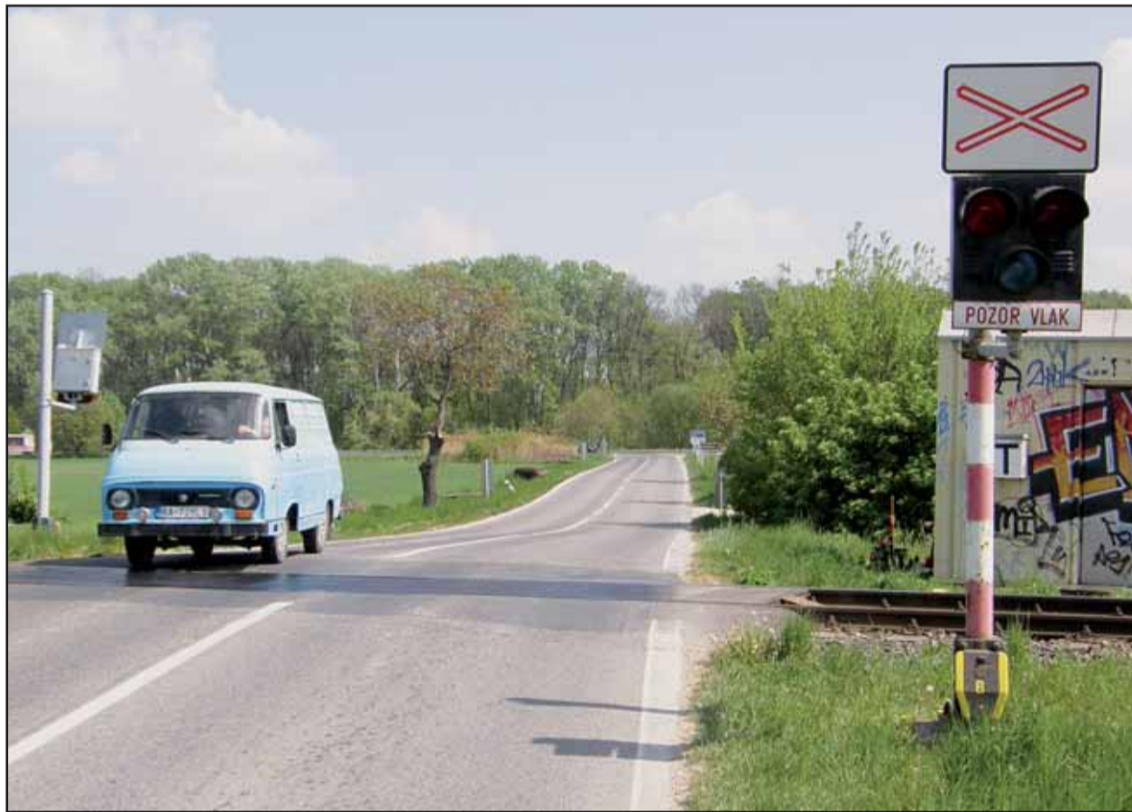
Nechránené železničné priesestie v Jarovciach sa už stalo dejiskom niekoľkých tragických dopravných nehôd. Napriek tomu tu závory nebudú minimálne do konca roka 2008.

Pri križovaní železničnej dráhy s pozemnou komunikáciou má železnica vždy prednosť. Pred železničným priesestím je vodič povinný počínať si mimoriadne opatrne a najmä presvedčiť sa, či môže bezpečne prejsť cez železničné priesestie. (rob)