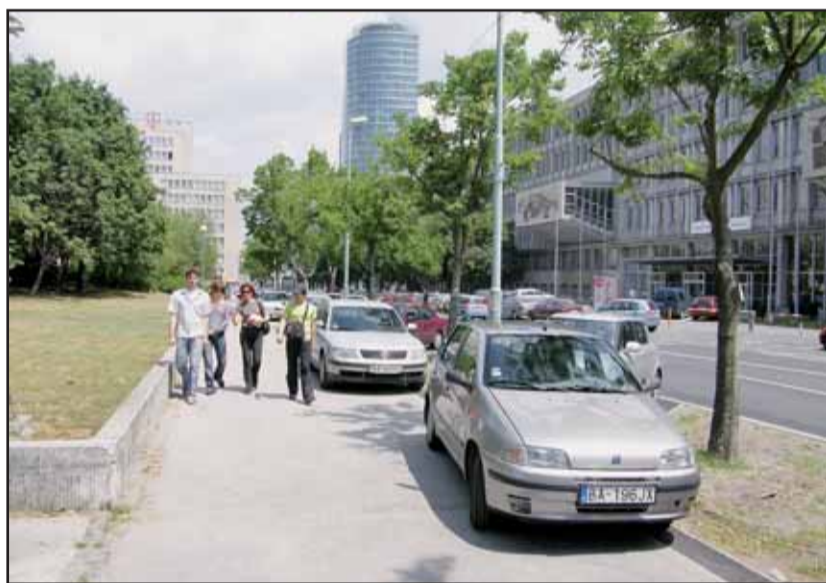
Magistrátu sa na chodníku v dolnej časti Námestia slobody darí robiť poriadok iba postupne. Časť chodníka v smere od Mýtnej ulice už patrí iba chodcom (hore), zvyšnú časť zatiaľ okupujú arogantní vodiči (dole).