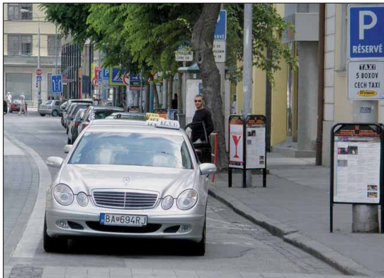
Len na Jesenského ulici majú taxikári vyhradených spolu 9 parkovacích miest. Trochu veľa, nie?

Samospráva v Starom Meste bude odteraz zakaždým iniciovať so spoluvlastníkom rokovania o možnosti previesť spoluvlastnícky podiel na jednotlivých bytoch na ich nájomcov. Okrem iného sú v pravidlách presne stanovené aj podmienky, za ktorých bude možný predaj spoluvlastníckeho podielu mestskej časti spoluvlastníkov. (juh)