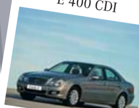
Mercedes-Benz Triedy E 400 CDI

Farba: strieborná metalíza Interiér: čierna koža/látka Stav km: 33 000 Rok výroby: 2004