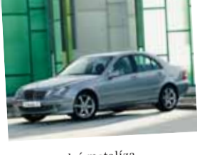
Mercedes-Benz Triedy C 200 Kompressor

Farba: modrá metalíza Interiér: čierna látka Stav km: 83 200 Rok výroby: 2003