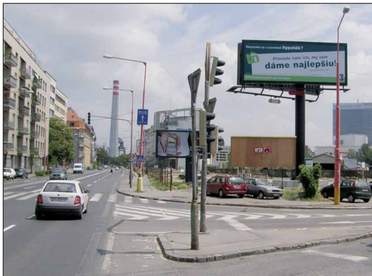
Bratislava získava ďalší prívlastok - stáva sa mestom reklamy. Ulice mesta pôsobia dojmom, že reklamná plocha tu môže byť kdekoľvek. A tak pribúdajú bigbordy, billboardy, citylighty - mnohé dokonca na čierno...

V súčasnosti sa ešte len pripravuje rozhodnutie primátora Bratislavy, ktorým sa určia podmienky a postup vo veci uzatvárania nájomných zmlúv na umiestnenie reklamných, informačných a propagačných zariadení na nehnuteľnostiach vo vlastníctve a správe hlavného mesta. Bratislava tak zatiaľ naďalej zostáva rajom pre reklamné agentúry, ktoré v nej rozmiestňujú bilbordy a inú vonkajšiu reklamu - bez ohľadu na to, či je to estetické alebo nie. (juh)