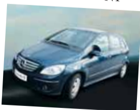
Mercedes-Benz Triedy B 180 CDI - N1

Farba: svetlomodrá metalíza Interiér: čierna látka Stav km: 12 000 Rok výroby: 2006