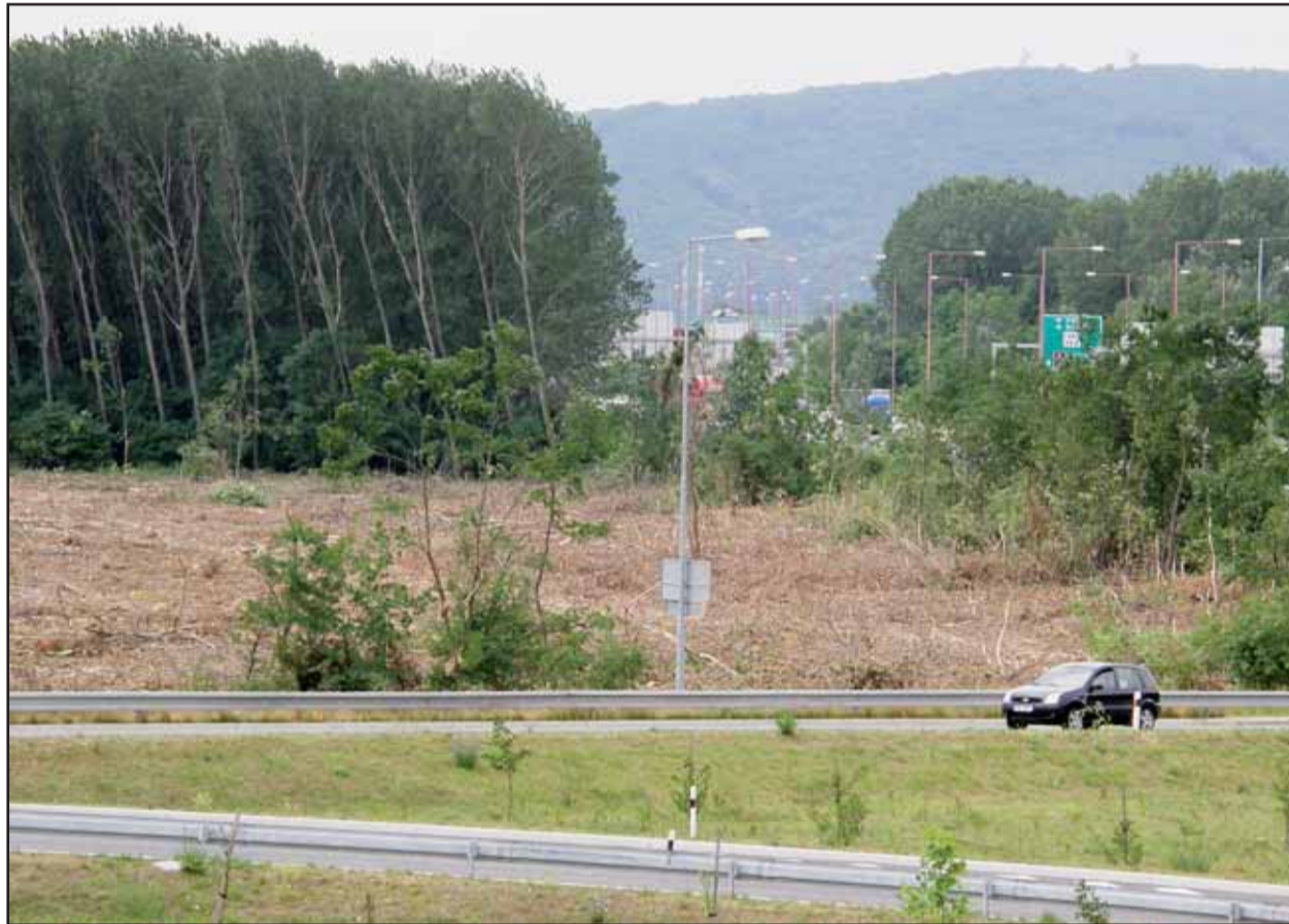
Časť Pečnianskeho lesa, odkiaľ lesníci vyťažili drevo, sa onedlho začne zalesňovať...

Upokojiť sa môžu aj tí, čo sa báli straty zvukovej bariéry medzi diaľnicou a sídliskom - bývalé koryto Pečnianskeho ramena ponechali zarastené náletovými drevinami. Drevorubači sem prídu až po tom, keď dostatočne vyrastie na vyrúbanom úseku nový les. Gustav Bartovic