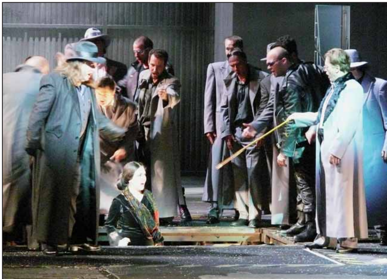
Prvou operou, ktorá mala v novom Národnom divadle premiéru, je Verdiho Trubadúr...

Výstava približuje vznik spoločnej antickej kultúry v severných provinciách rímskeho impéria a kontakty Rimanov s obyvateľstvom za ich hranicami. Návštevníci vstúpia do doby rímskej nadvlády prostredníctvom významných archeologických nálezov, medzi ktoré patria kópia bronzovej sochy cisára Augusta z Prima-porty v nadživotnej veľkosti, soška rímskeho boha plodnosti Priapa alebo množstvo keramických predmetov. Nechýbajú ani rekonštrukcie rímskych stavieb (kúpele, koloseum, aquadukt) či doklady písomníctva. Vystavené predmety pochádzajú z lokalít Stupavy, Bratislavy, Iže a Zohora. (dš)