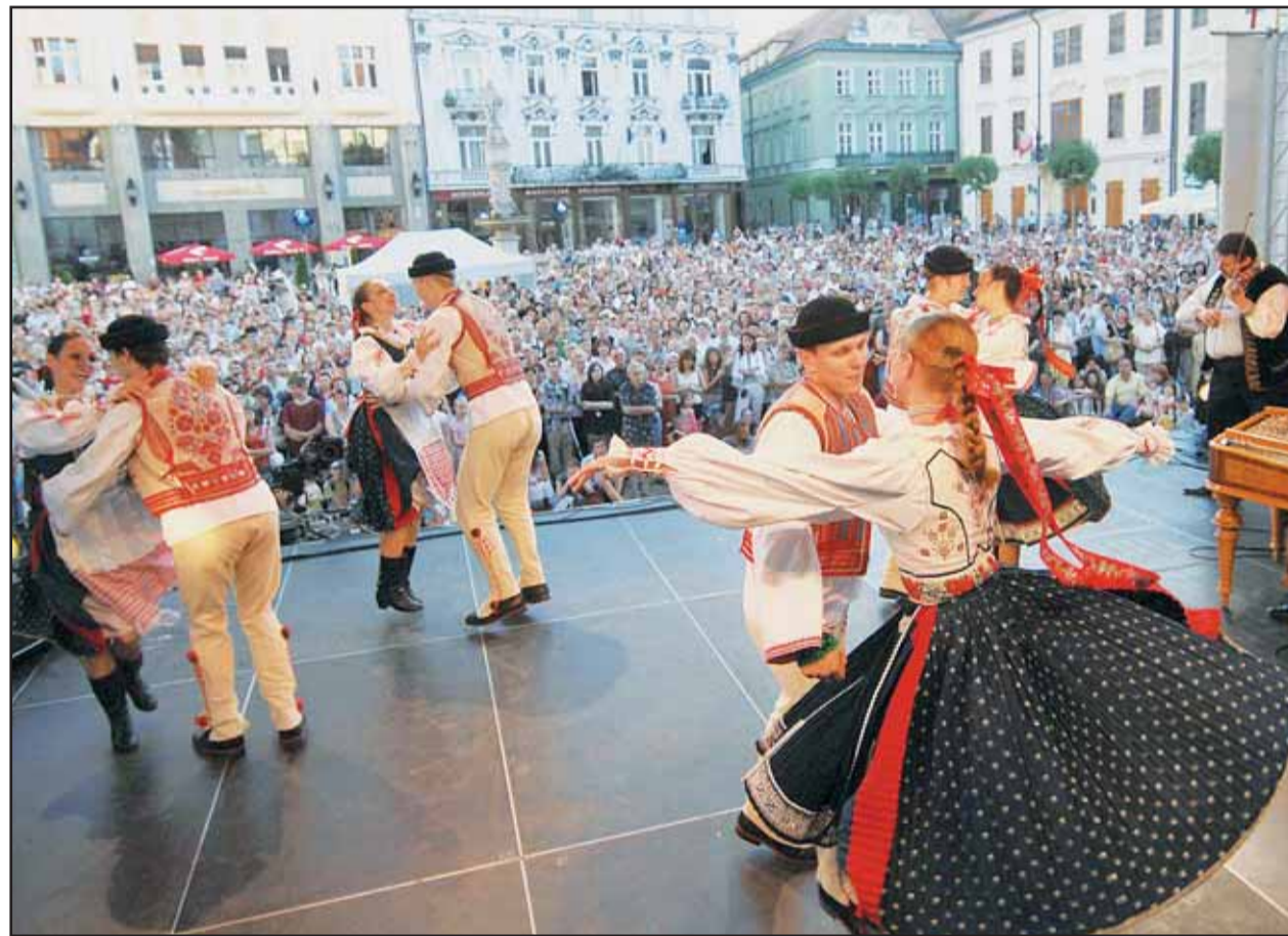
O mimoriadny zážitok sa Bratislavčanom pri otvorení Kultúrneho leta postarala Lúčnica.