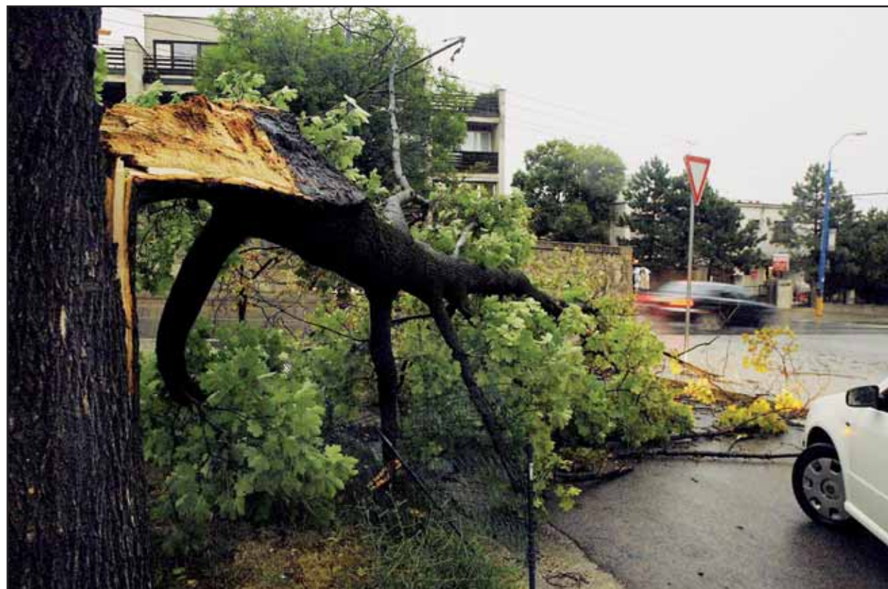
Takúto spúšť zanechala minulý týždeň víchrica na Mudroňovej ulici.

V poisťovni Allianz-Slovenská poisťovňa bolo následkom škôd počas víchrice a búrok nahlásených v rámci mesta viac ako 300 poistných udalostí. Najväčšie škody vznikli na strešnej konštrukcii reštaurácie v dôsledku pádu víchricou odtrhutej strechy z vedľajšej budovy. Ďalej ide o poškodený stožiar prenosu signálu mobilnej siete a poškodený megaboard.. Celková škoda je zatiaľ odhadovaná na 8 miliónov korún. (rob)