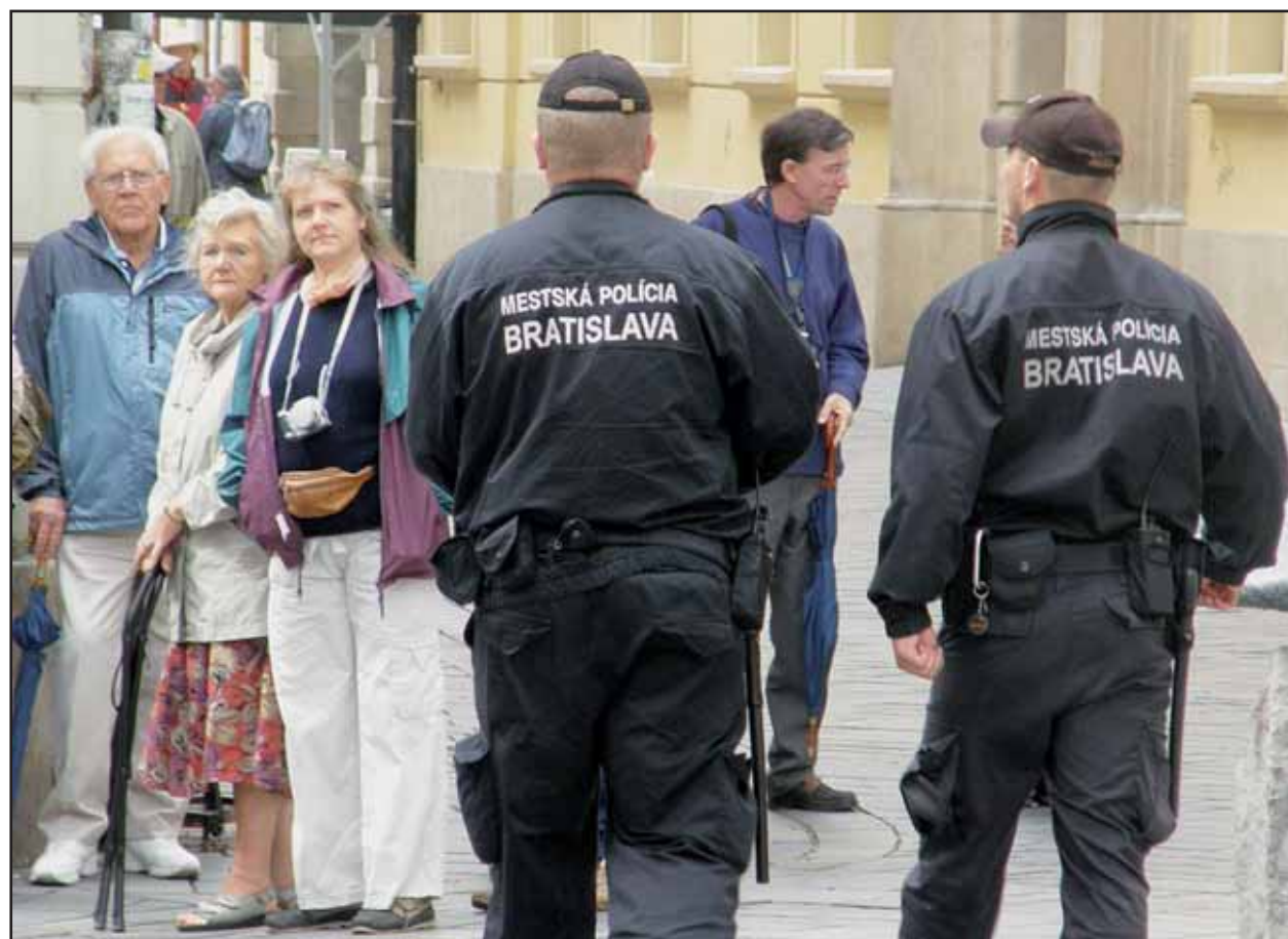
O vyššiu bezpečnosť v pešej zóne sa starajú posilnené hliadky Mestskej polície.

Od 1. do 10. júla bude každý deň na internete zverejnená iná vedomostná otázka o Burgenlande. Kto správne odpovie, bude zaradený do zberovania o cestovné lístky. Každý deň môže vyhrať päť Bratislavčanov po dva lístky na cyklovlak do Parndorfu, odkiaľ povedie cyklotúra k Nezdierskému jazeru. Viac na www.BratislavskeNoviny.sk (red)