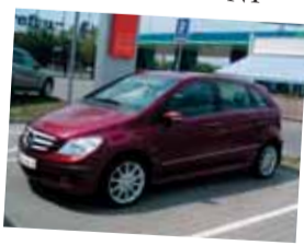
Mercedes-Benz Triedy B 180 CDI - N1

Farba: bordová metalíza Interiér: čierna koža/látka Stav km: 7 000 Rok výroby: 2006