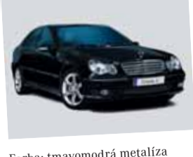
Mercedes-Benz Triedy C 200 Kompressor

Farba: tmavomodrá metalíza Interiér: čierna látka Stav km: 83 130 Rok výroby: 2004