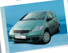
Mercedes-Benz Triedy A 180 CDI

Farba: tyrkysová metalíza Interiér: čierna látka Stav km: 44 100 Rok výroby: 2004