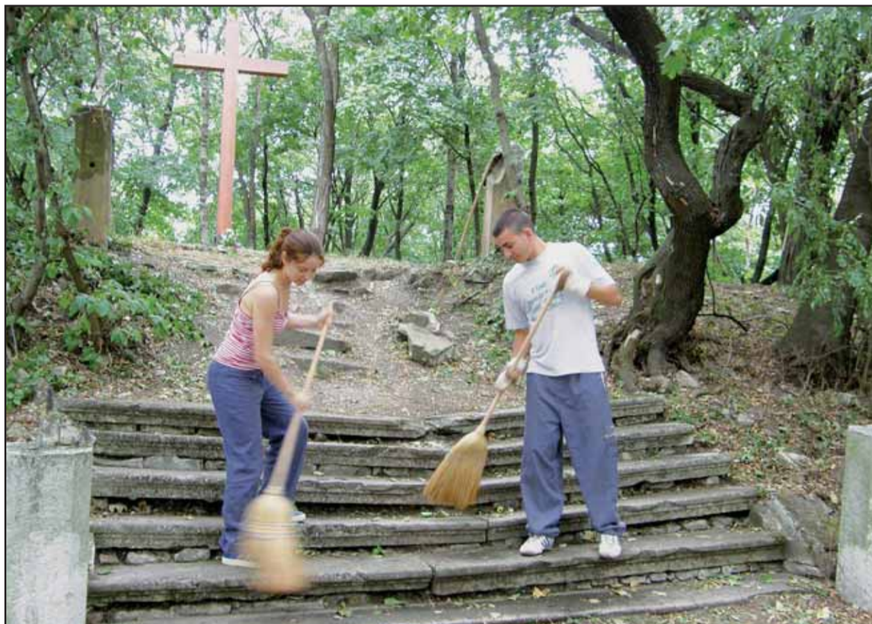
Mladí zahraniční dobrovoľníci sa pri obnove zameriavajú na čistenie chodníkov a lesa od odpadkov, popadaných konárov a stromov. Veľa práce urobili najmä pri čistení križovej cesty.

Projekt je iba na začiatku - mestská časť Bratislava - Staré Mesto má vypracovanú dokumentáciu na stavebné povolenie. Revitalizácia Kalvárie je veľmi rozsiahly a časovo i finančne náročný projekt, ktorý pozostáva z troch častí - prvou z nich je biologická revitalizácia, po nej by mali nasledovať archeologické práce a napokon by sa mali vybudovať stavebné objekty. Práce mladých dobrovoľníkov sú súčasťou biologickej revitalizácie. (juh)