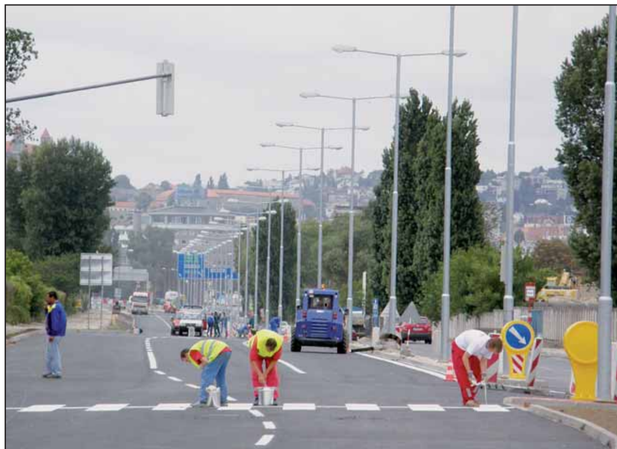
Prístavná ulica by sa mala do konca prázdnin zmeniť na štvorpruhovú komunikáciu.