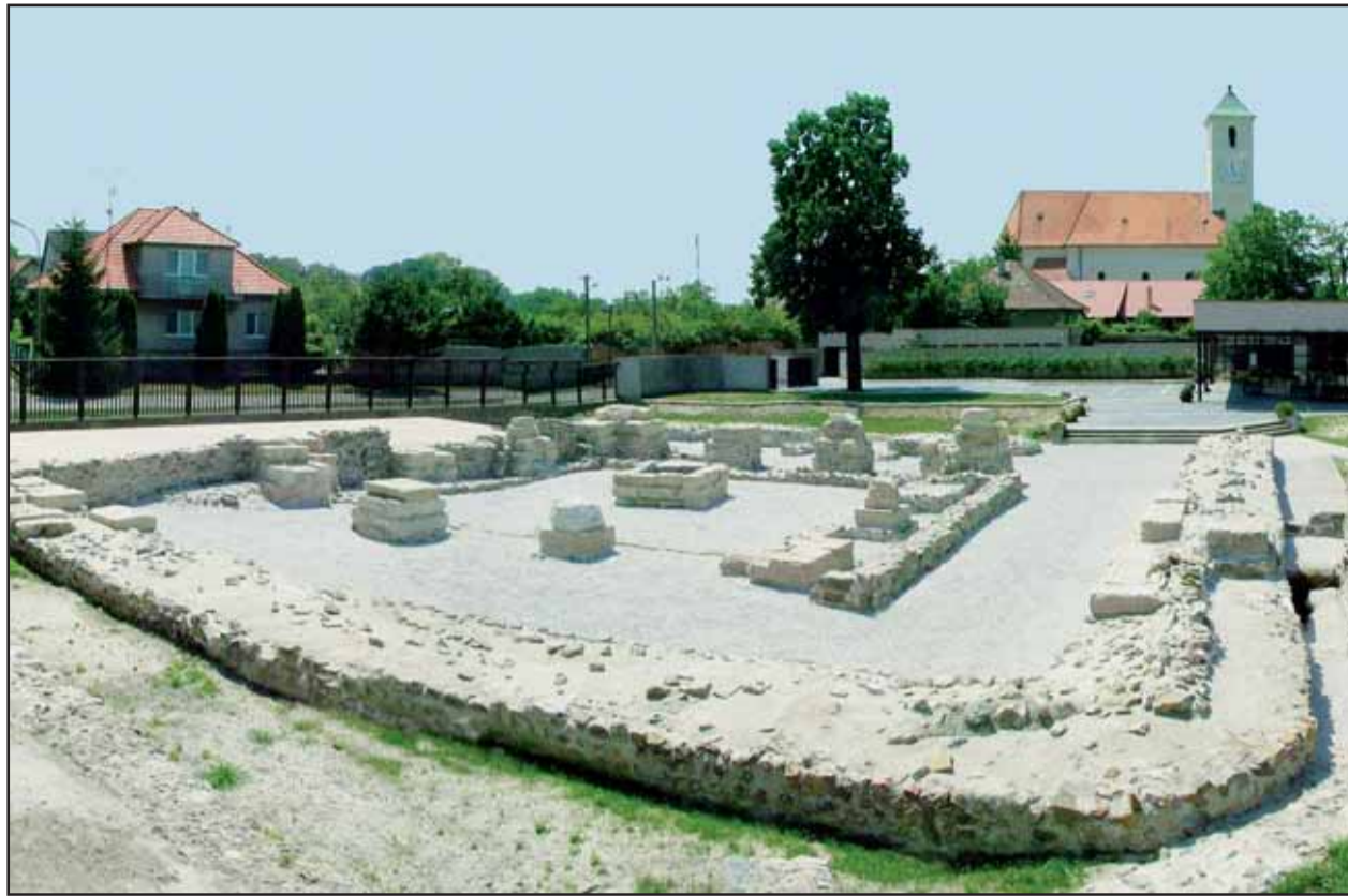
Vynovenú Gerulatu po 2000 rokoch opäť navštívia Rimania - rečníci, filozofi, umelci...

Po dlhoročnej spolupráci poskytol Lasica tieto texty na zhudobnenie spevákov a autorov, s ktorým má okrem generáčnej príbuznosti spoločné aj hudobné korene. Peter Lipa sa stal totiž známy aj vďaka vynikajúcim textom Milana Lasicu ako Podobnosť čisto náhodná (o synovi), Prosperita alebo Balada o štyroch koňoch. (dš)