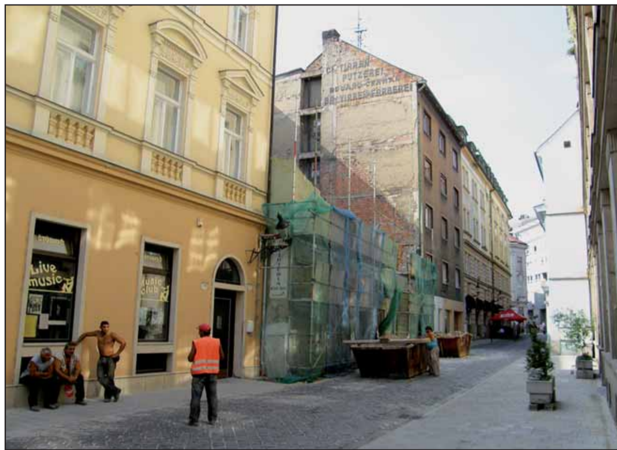
Ak sa nepredĺži historický prieskum, do konca roka tu bude stáť hrubá replika historického domu.

Navýše po piaty raz budú prvý septem- brový víkend v hlavnom meste Koruno- vačné slávnosti, tentoraz v znamení korunovacie Anny Tirolskej. Korunovač- ný sprievod sa vydá v sobotu o 10.00 h z Bratislavského hradu na Hlavné námestie, kde bude od 10.30 h približne hodi- nový obrad korunovacie (vstup voľný). Z centra mesta sa potom kráľovský sprievod a celé Korunovačné slávnosti presunú na pravý breh Dunaja na Tyršo- vo námestie, kde sa o 16.00 h začína Rytiersky turnaj (vstupné: 200 Sk dospelí, 100 Sk deti od 6 rokov). Korunovač- ný deň ukončí koncert Missa solemnis od Jána N. Hummela, ktorý sa začína o 20.00 h v Dóme sv. Martina (vstupné: 350 Sk dospelí, 150 Sk deti od 6 rokov). V nedeľu Korunovačné slávnosti pokračujú na Tyršovom nábreží od 14.00 do 20.00 h (ado)