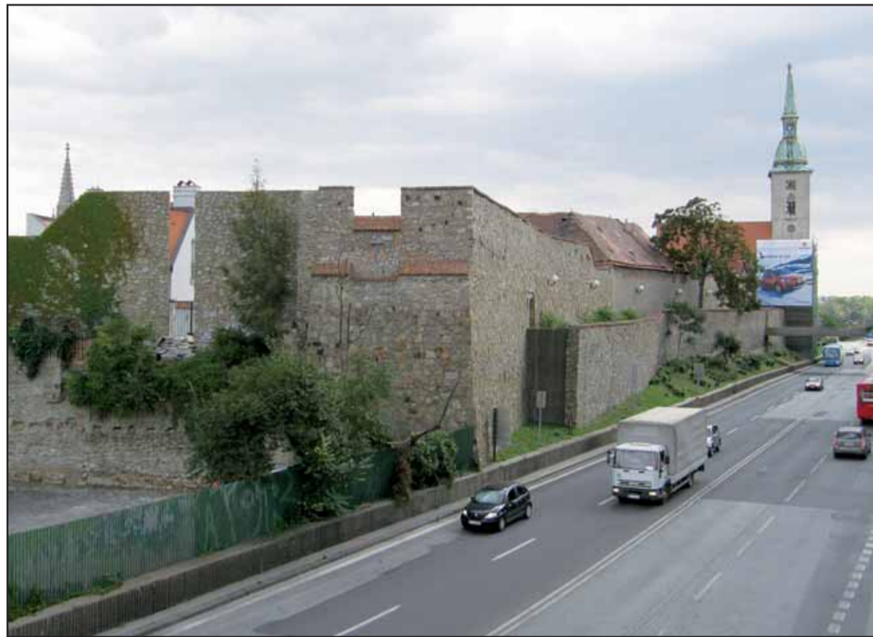
Namiesto uvažovania by samospráva mesta mala torzo niekdajšieho opevnenia čo najskôr sprístupniť.