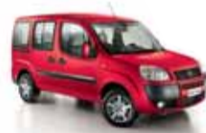
Fiat Doblo Combi** 5-miestna verzia s možnosťou odpočtu DPH.

Panonská cesta 21 851 04 Bratislava tel.: 02/63 83 77 91