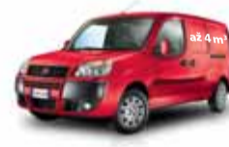
Fiat Doblo Van 2 miesta, objem nákladového priestoru až 4 m 3 .