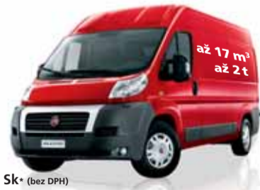
Fiat Ducato až od 549 900 Sk* (bez DPH)

Základná výbava: ABS, airbag vodiča, posilňovač riadenia, výškovo nastaviteľný volant a veľa ďalších prvkov. Nákladový priestor až 4 m 3 , ložný priestor na dve europalety, užitočná hmotnosť až 850 kg. V ponuke tiež revolučný turbodieselový motor 1,3 Multijet 16v s výkonom 75 koní a spotrebou len 5,4 l/100 km. Pre verziu Van tiež CNG pohon na zemný plyn.