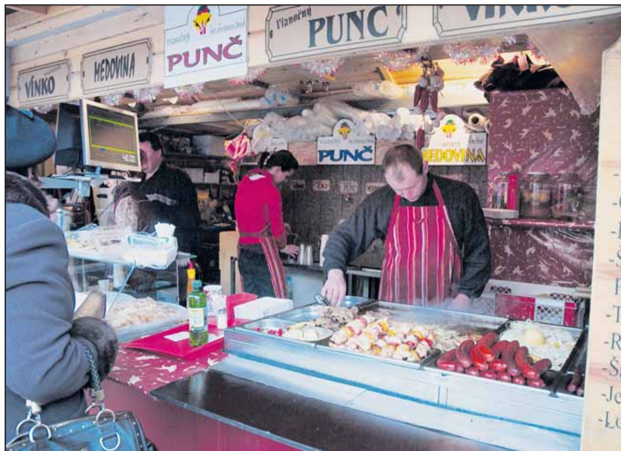
Vianočné trhy nie sú len o nákupe darčiekov, najväčší záujem je stále o tradičné grilované špeciality.

Požiadali sme o stanovisko k tomuto prípadu aj spoločnosť Incheba, a.s., odpoveď sme však do uzávierky nedostali. (gub)