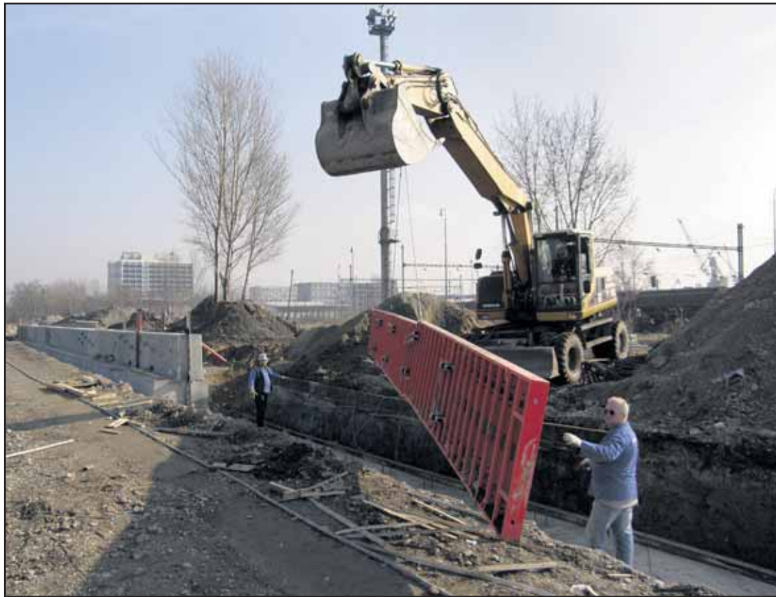
Výstavbu protipovodňovej zábrany na Prístavnej ulici by mali ukončiť do konca tohto roku.

Plánované zjednosmerňovanie sa týka komunikácií najmä druhej triedy. Nejde o ulice v husto obývaných častiach mesta. (rob)