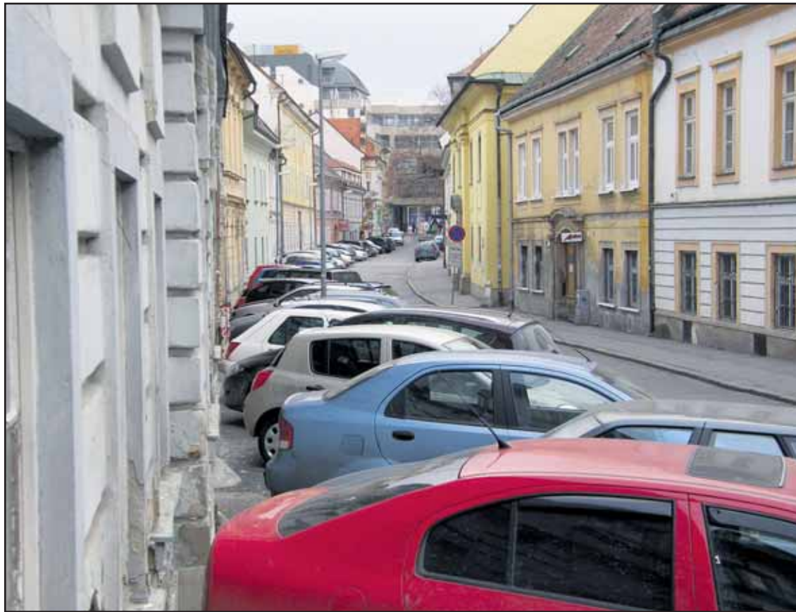
Chodník na jednej strane Panenskej ulice je beznádejne nepriechodný - je tu parkovisko.

Na budovy PKO je vydané platné búracie povolenie a podľa mesta návrh na vyhlásenie PKO za pamiatku prišiel neskoro. Mesto je povinné ochrániť cenné vitráže a sochy. V súčasnosti rokujú s investorom, aby ich projektanti zahrnuli do objektov budúcej zástavby nábrežia. (rob)