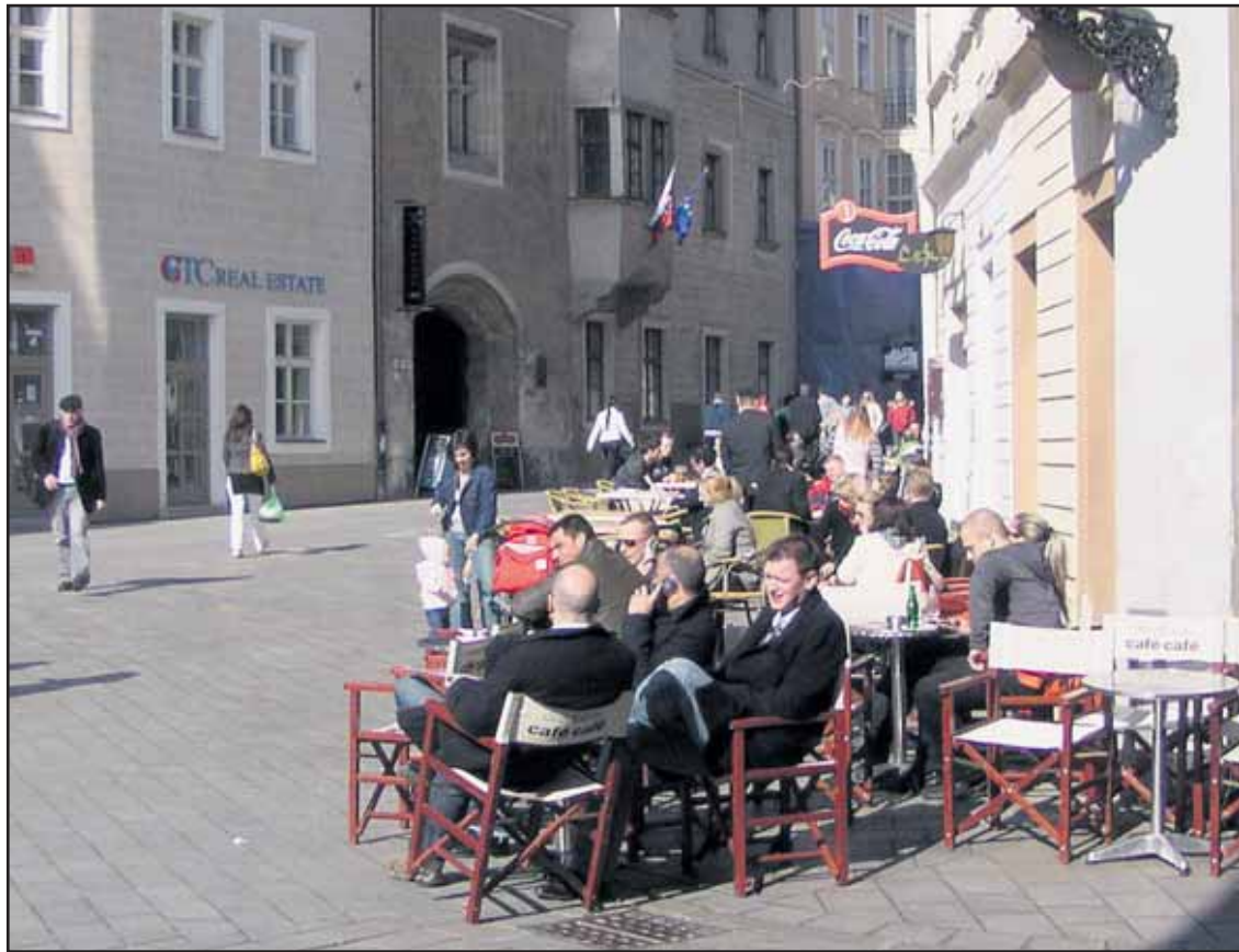
Staromestská samospráva toleruje nelegálne podnikanie na verejnom priestranstve.

Malo by mestské zastupiteľstvo vyhlásiť PKO za pamätihodnosť mesta? Môžete sa vyjadriť v novej internetovej ankete na našej webstránke www.bratislavskenoviny.sk . (juh)