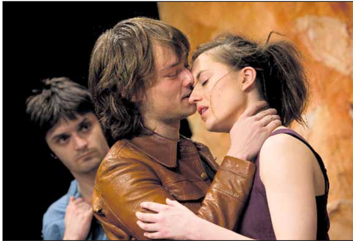
Z úst aktérov Osbornovej hry v podaní študentov VŠMU sa rinú nadávky a osočovania.

V utorok 25. marca čaká návštevníkov Reduty ďalší výnimočný hudobný zážitok. O 19.00 h sa začne vystúpenie 130-členného orchestra European Union Youth Orchestra s dirigentom Vladimírom Ashkenazym. Na programe je Eugen Suchoň, Jean Sibelius a Richard Strauss. (dš)