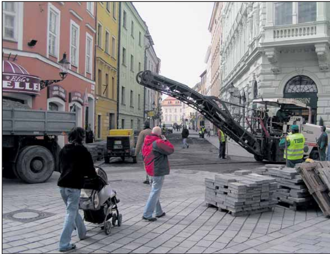
Obnova dlažby v pešej zóne by sa mala skončiť v máji. Dovtedy bude z korza stavenisko.