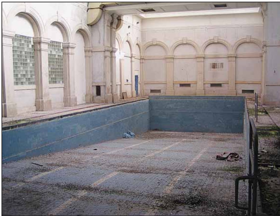
Obnova dlhé roky nevyužívaných kúpeľov Grössling sa má začať ešte v tomto roku.

Aktuálne dopravný podnik prevádzkuje približne 450 autobusov rôznych typov, ich priemerný vek je asi 12 rokov. Nízko-podlažných autobusov je 45. (rob)