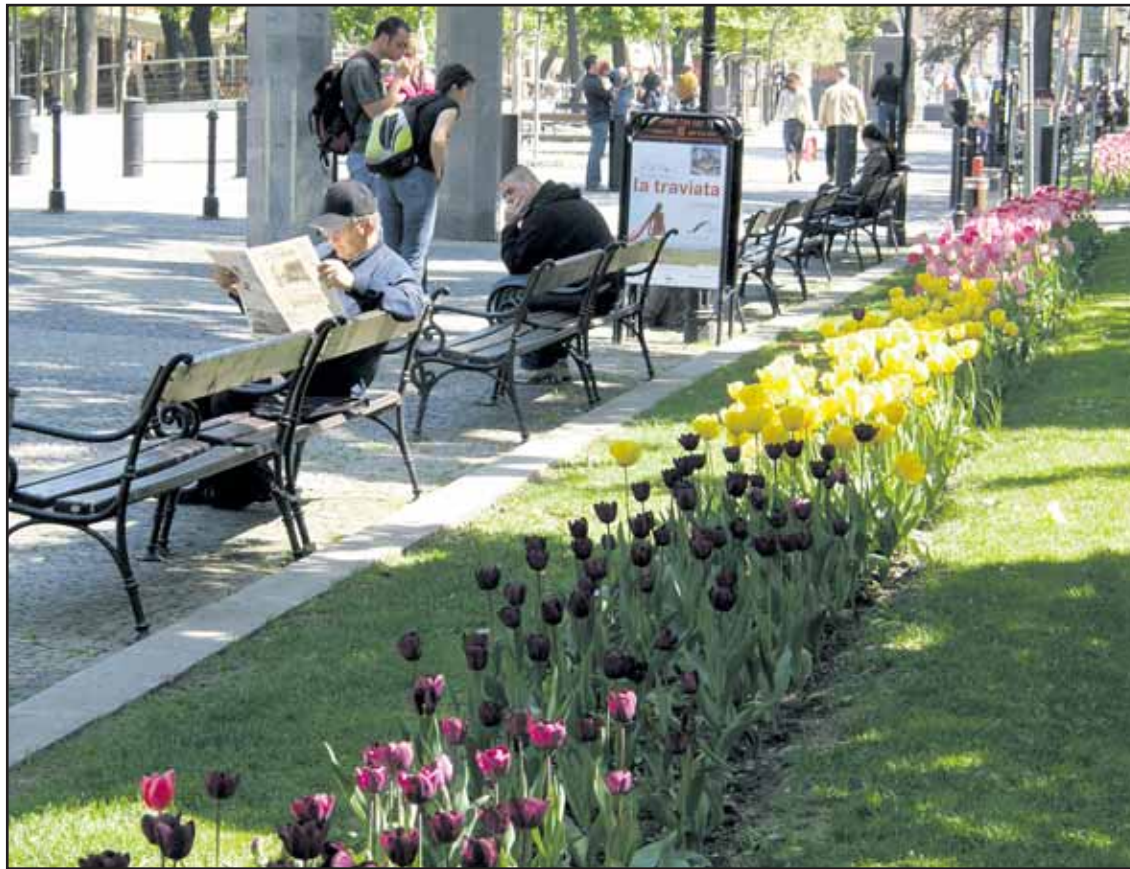
Tulipány budú krášiť verejné priestranstvá v centre mesta iba do polovice mája.

Na skvelej návštevnosti sa podpísalo nielen pekné počasie, ale aj fakt, že mestská hromadná doprava bola počas celého víkendu zadarmo. (brn)