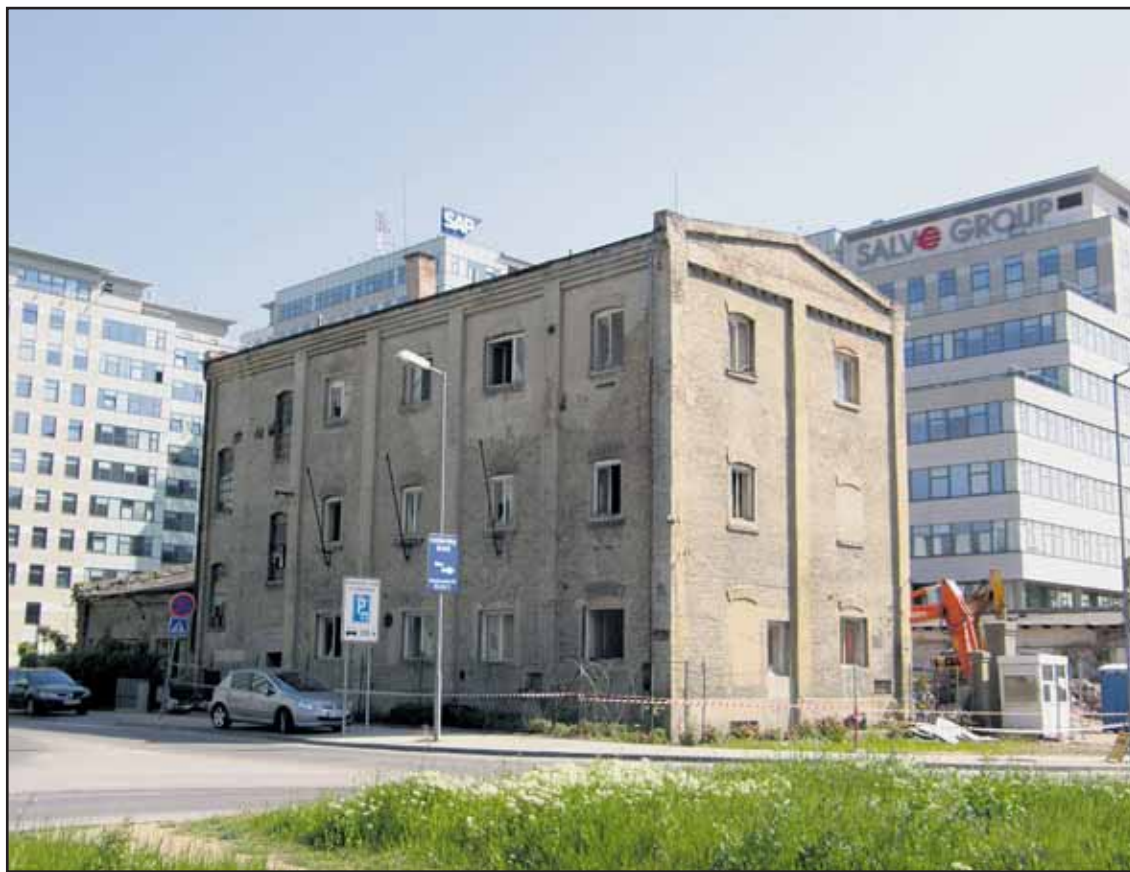
Ďalší pamätník priemyselnej architektúry mesta čoskoro zmizne...

Pôvodne cestný tunel začala v roku 1943 stavať rakúska tunelovacia spoločnosť, počas vojny slúžil ako kryt pred leteckými útokmi. Dokončili ho v roku 1947 a meria viac ako 792 metrov. Električková doprava slúži v prospech mestskej hromadnej dopravy od druhej polovice roka 1983. Mesto ho v roku 1984 zverilo do správy vtedajšiemu dopravnému podniku. V tuneli sa robil prieskum a drobné opravy začiatkom tohto storočia. V súčasnosti tam platí pre električky osobitný rýchlostný režim. (rob)