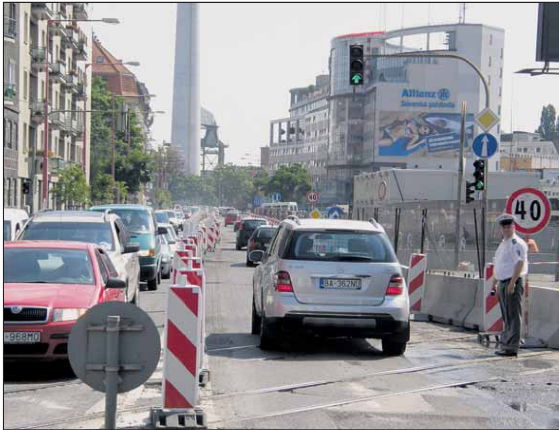
So zápchami na Dostojevského rade treba rátať až do ukončenia rekonštrukcie 14. septembra.

Od 1. júla do 12. septembra v priestore Dostojevského radu a Pribinovej ulice pribudnú stredové ostrovčeky, cestná svetelná signalizácia, priechody pre chodcov a pod. Od 1. augusta do 14. septembra bude po celej dĺžke Dostojevského radu frézovaná ľavá polovica vozovky, dokončia inštalovanie svetelnej signalizácie a osadia zvislé a vodorovné dopravné značenie. (brn)