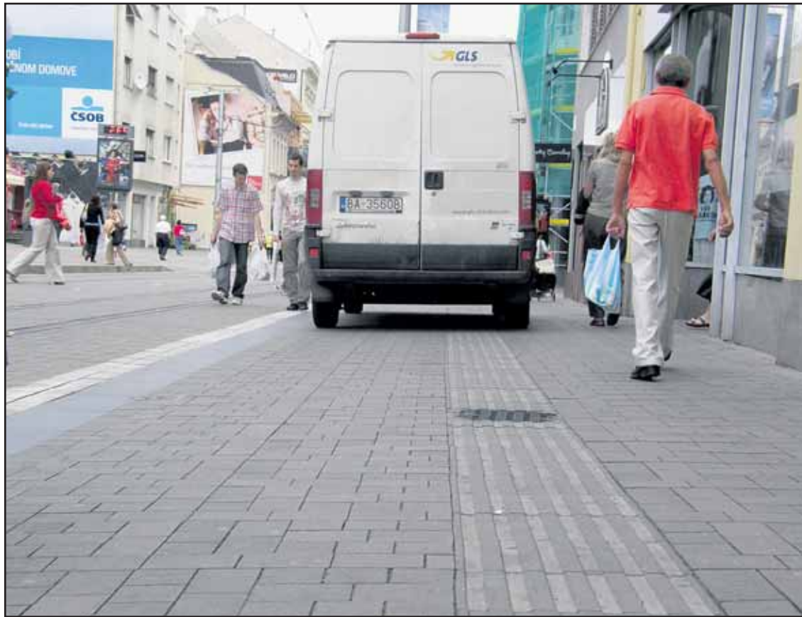
Na vodiacom páse pre nevidiacich na Obchodnej ulici stálo auto aj popoludní 16. júna 2008.

Teraz nás zaujíma, ako Bratislavčania vnímajú rozhodnutie primátora prestať Zimný štadión O. Nepelu. Súhlasíte s prestavbou starého zimného štadióna namiesto výstavby novej haly? Hlasujte na www.banoviny.sk (red)