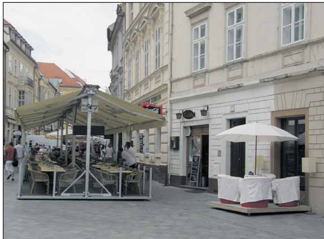
Malá letná terasa v dolnej časti Ventúrskej ulice by mala do konca mesiaca zmiznúť. Podľa pravidiel schválených staromestskou samosprávou tu nemá čo robiť.

Ohlasy návštevníkov pešej zóny na nové rozmiestnenie exteriérových sedení na Michalskej a Ventúrskej ulice sú pozitívne. Poriadok a jasné pravidlá ocenili aj prevádzkovatelia dotknutých reštaurácií a kaviarní. Samospráva Starého Mesta je preto pripravená od budúcej sezóny podobným spôsobom regulovať letné terasy aj na ďalších uliciach historického jadra mesta. (pol)