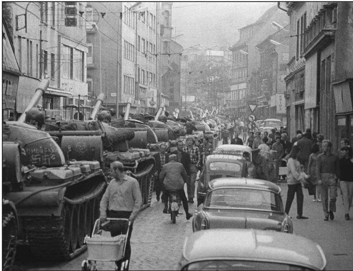
Bratislava pred 40 rokmi: Obchodná ulica bola 21. augusta 1968 plná sovietskych tankov.

Súťažieť budeme na webe, podrobnosti budú zverejnené 1. septembra 2008 na www.banoviny.sk. Okrem hlavnej ceny, ktorou je šestnásťdňový zájazd do Mexika od cestovnej kancelárie Bubo, máme pre ďalších sto výhercov pripravené originálne sladké prekvapenie. (red)