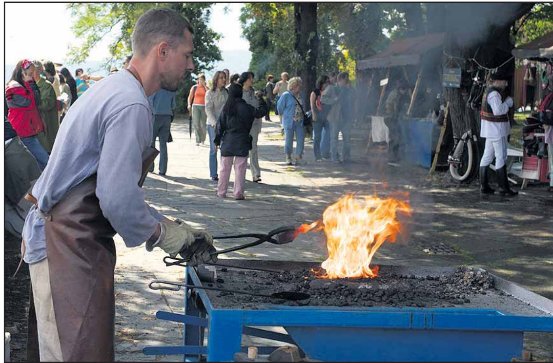
Návštevníci sa môžu tešiť aj na majstrov, ktorí pripomenú slávu slovenských kováčov...

Vstupenky budú v predaji v pokladnici Slovenskej filharmónie, Suchoňovo námestie 1 od 1. septembra 2008 alebo v sieťach eventim a Ticketportal. (dš)