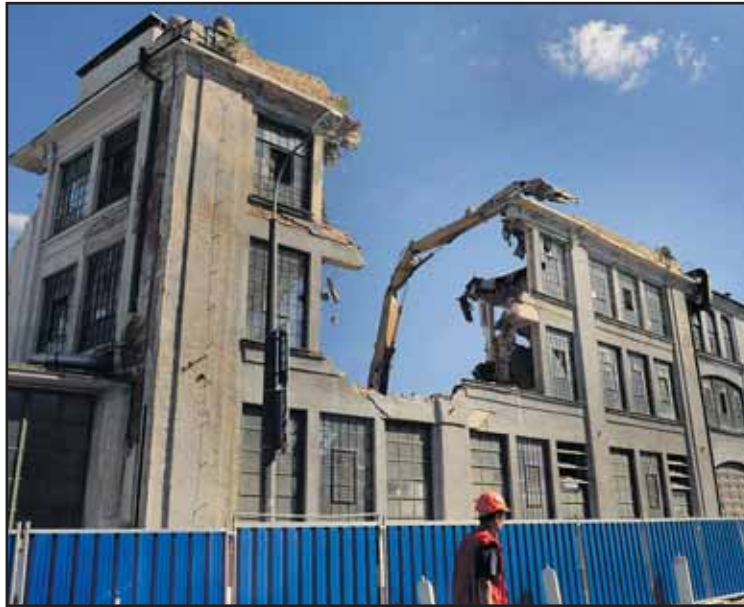
Koncom augusta sa stroje zahryzli do budovy Starej lisovne, dnes už z nej nič nezostalo.