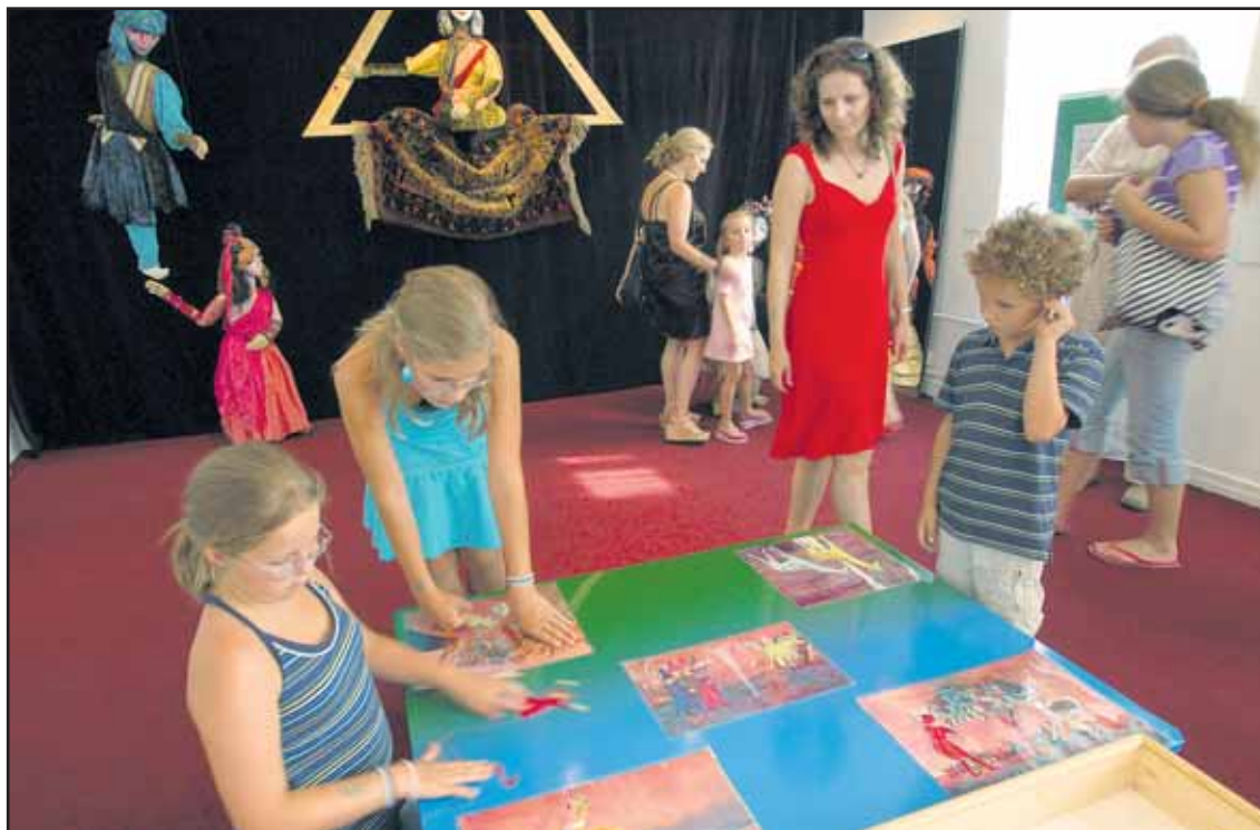
Pre deti je spoznávanie bábok výletom do sveta tajomstiev a fantázie.

Viac o bratislavskej kultúre sa dozviete na www.banoviny.sk