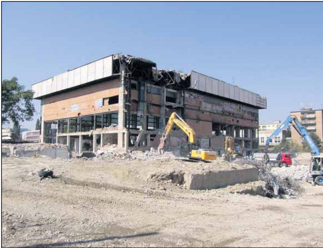
Kúpele Centrál v uplynulých dňoch zbúrali, vyrastie tu viacúčelové centrum Centrál.

Táto časť bola najhúlostivejším úsekom Dunaja pre Bratislavu a pre celý Žitný ostrov. Protipovodňový múr a podzemné clony na Prístavnej ulici sú súčasťou deviatich stavieb na ochranu Bratislavy a južného Slovenska pred tisícročnými vodami. Sústava sa bude predovšetkým z peňazi Európskej únie, ďalej prispievajú štátny rozpočet a Slovenský vodohospodársky podnik. V súčasnosti zostávajú pre mesto dva kritické úseky - brehy medzi Starým a Novým mostom. Presná podoba a termín dokončenia budú známe po prijatí definitívnej verzie rekonštrukcie Starého mosta a jeho nájzdov. (gub)