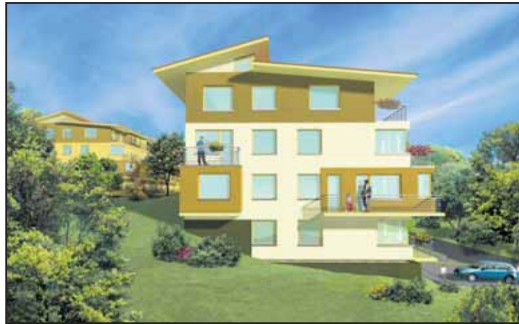
Pôvodný návrh jedného z viladomov...