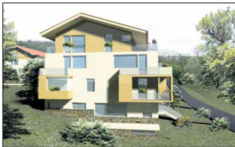
... a upravený návrh, ktorý má byť kompromisom.