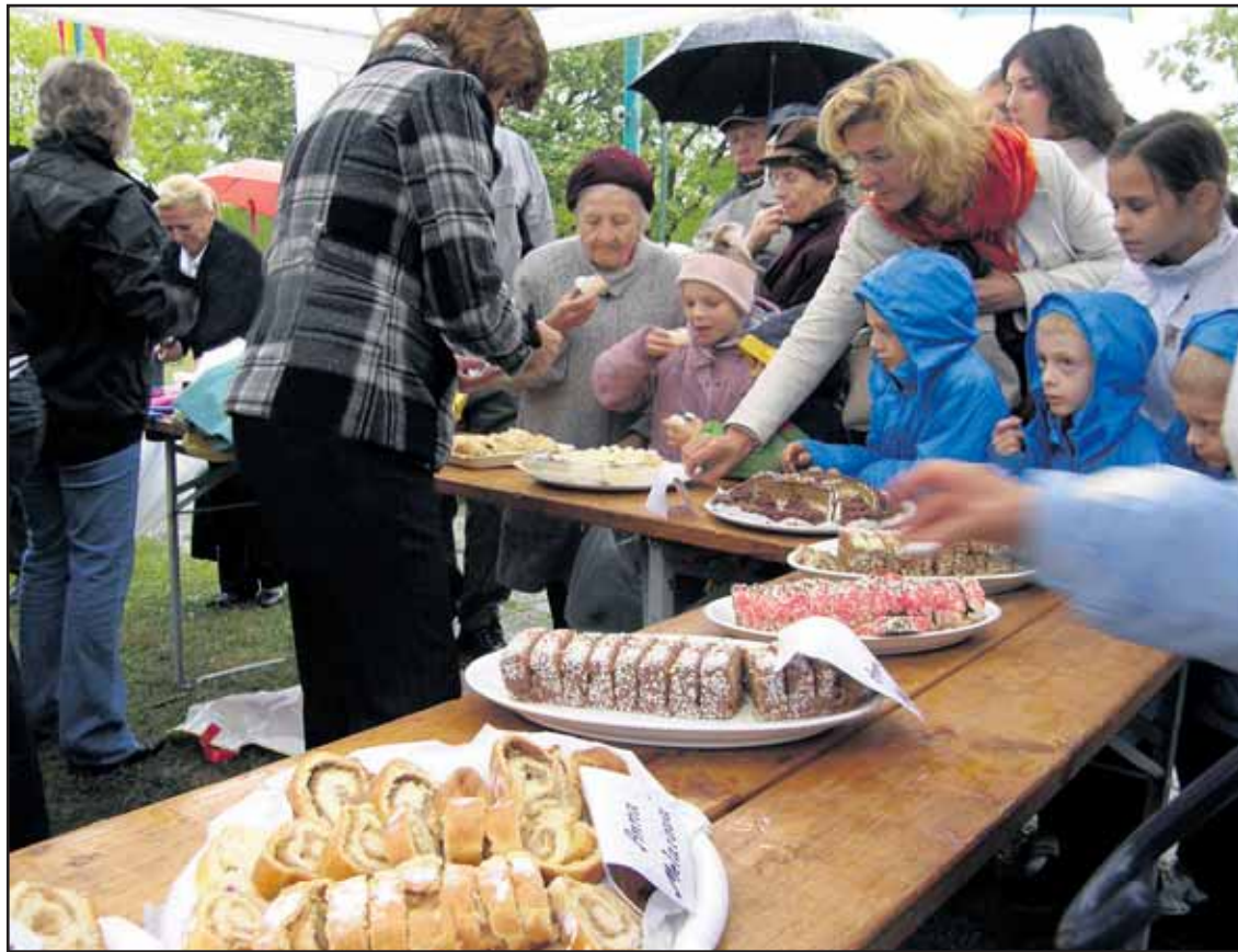
Návštevníci Vajnorských hodov si nenechali ujsť ani ochutnávku hodových koláčov.

Nezvyšovanie cien cestovného v MHD bude mesto kompenzovať Dopravnému podniku Bratislava, a.s., tomto a v budúcom roku sa na to ráta so sumou 50 miliónov korún. (rob)