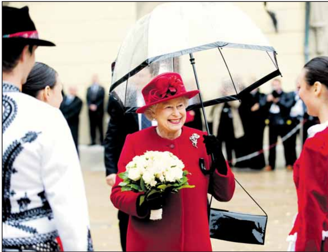
Kráľovná Alžbeta II. zaujala Bratislavčanov najmä svojou bezprostrednosťou.

V pondelok 10. novembra vyžrebujeme päť šťastlivcov, ktorí vyhrajú po päť voľných vstupov na obe klziská, ktoré spravuje STaRZ Bratislava. (red)