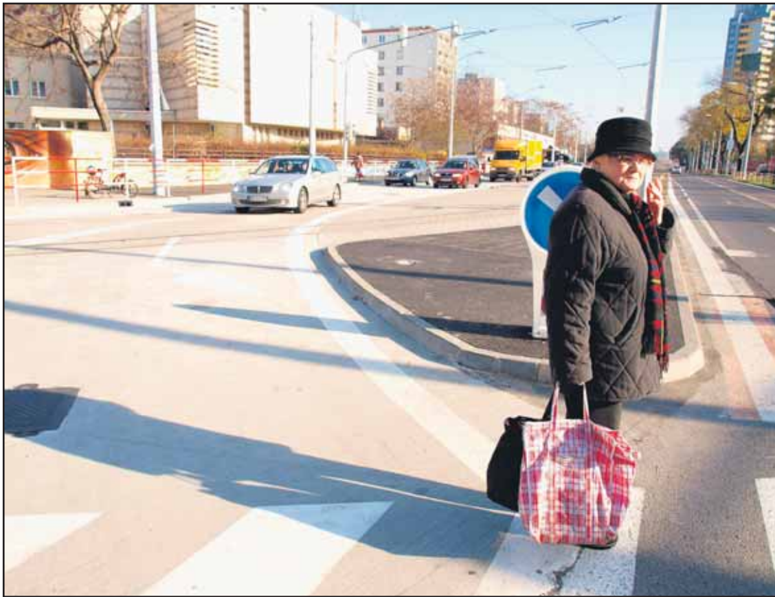
Od utorka je Záhradnícka ulica štvorprúdová aj v úseku od Bajkalskej po Miletičovú ulicu.