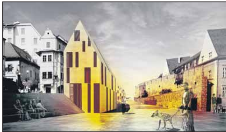
Hradbám dať novú funkciu - rozšíriť Židovskú ulicu, posilniť jej obytný charakter a vytvoriť novú silnú pešiu komunikáciu na Staromestskej ulici.