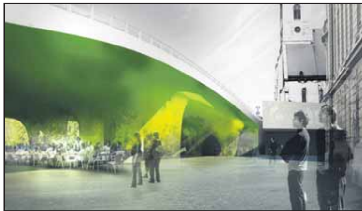
Vyriešiť problém podmostia Nového mosta, ktorý je komunikačnou bariérou medzi Starým Mestom, Podhradím, Vydricou a Zuckermädlom.