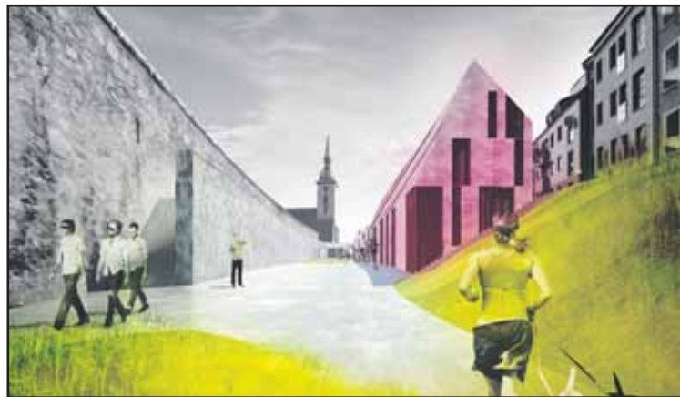
Staromestská ulica v úseku Židovskej ulice sa podľa autorov stáva aj so svojimi nevyužitými hradbami jedným z najpodstatnejších úsekov územia.

VIZUALIZÁCIE - Vallo sadovsky architects & Jan Studeny