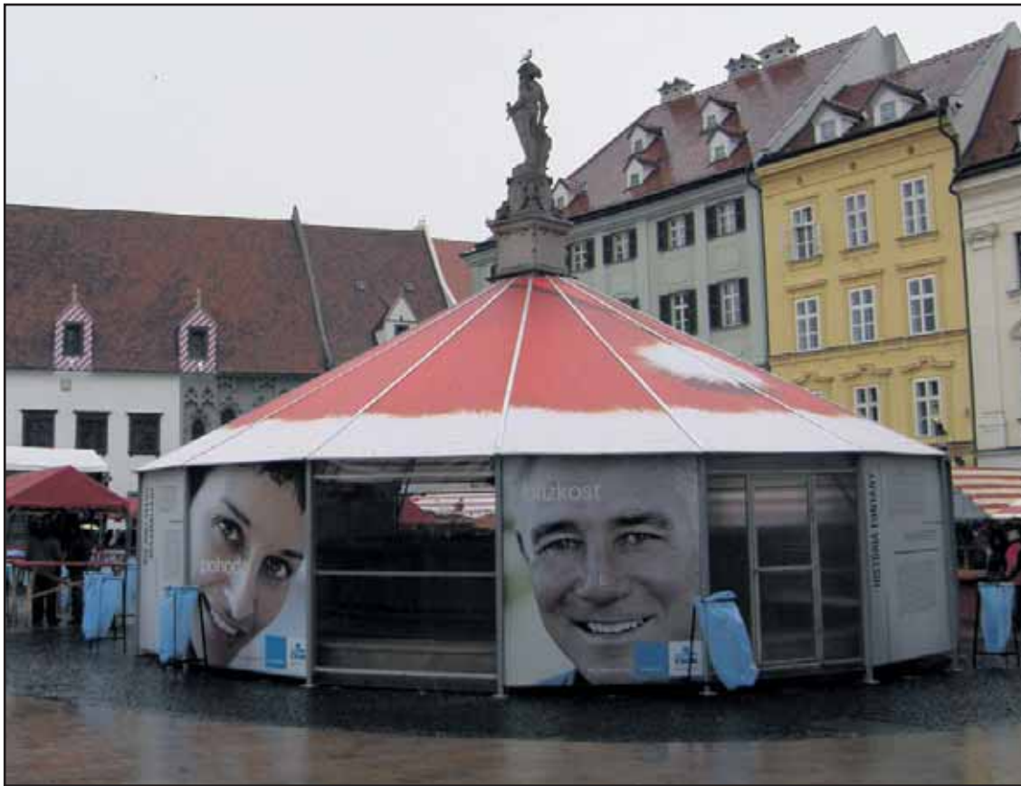
Nevkusná reklama si napokon našla cestu aj do historického jadra mesta. Skoro zadarmo.

Tieto ceny považuje BVS za likvidačné, pričom majú zostať rovnaké už štvrtý rok. Keďže klesá spotreba vody, BVS bude na budúci rok pravdepodobne musieť prejsť na krízové riadenie. Ohrozené sú nielen ďalšie investície do rozvodov vody a kanalizačnej infraštruktúry, ale aj údržba a opravy. D. Gemeran nevyhlásil, že budú musieť zmraziť mzdy zamestnancov. (pol)