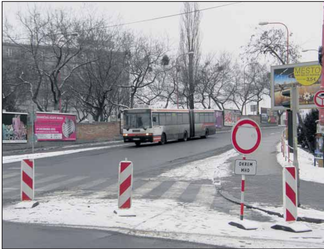
Na Starý most už vchádzajú len autobusy, pre individuálnu dopravu platí zákaz.

Paušálna ročná sadzba dane je totiž porovnateľná s ročným poplatkom za nerezervované miesto v podzemnej Garáži Carlton (3153,42 € / 95 000 Sk bez DPH) a garáži hotela Park Inn (3476,07 € / 104 720 Sk bez DPH), dokonca vyššia ako v Garáži Centrum na Uršulínskej ulici (2589,13 € / 78 000 Sk bez DPH) či v Garáži Opera na Jesenského ulici (2249 € / 67 753,37 Sk bez DPH). (ado)