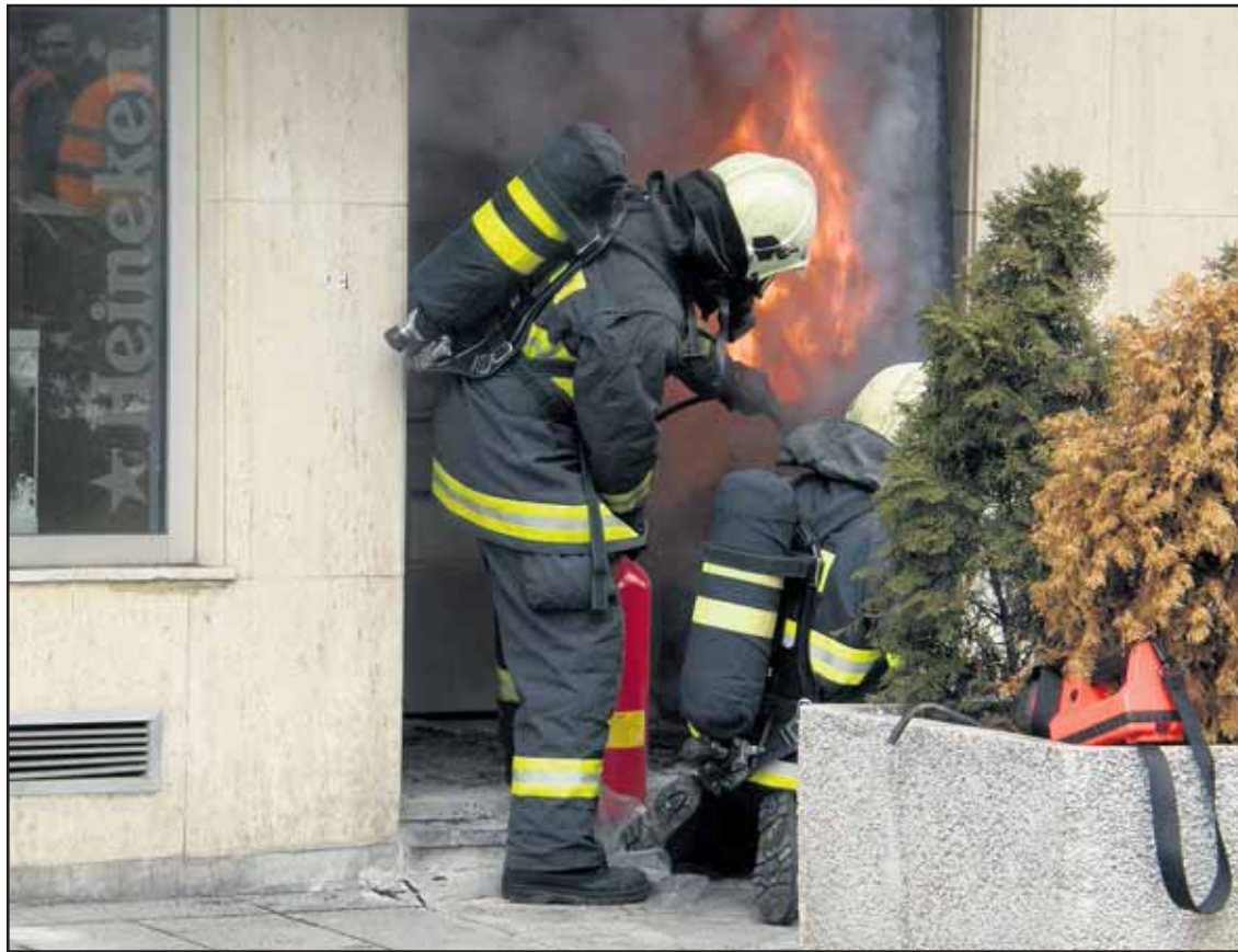
Hasiči prišli na miesto požiaru okamžite a zabránili tak väčšej katastrofe.

„Naozaj nehladáme len celoslovensky, či dokonca medzinárodne známe tváre. Pre mesto môže byť veľakrát oveľa dôležitejšia napríklad príkladná celoživotná poctivá práca v povolaniach, ktoré nezaplnia každý deň stránky novín,“ vysvetľuje Milan Vajda, vedúci oddelenia marketingu na bratislavskom magistráte. Aj preto sú z minulosti známe príbehy laureátov, medzi ktorými nájdeme lekára, matrikárku, knihovníka, smetiara, hasiča, policajta, ošetrovateľa zvierat, učiteľku, vinohradníka a zástupcov mnohých ďalších profesií, bez ktorých by sa v meste, akým je Bratislava, nedalo žiť. (hov)