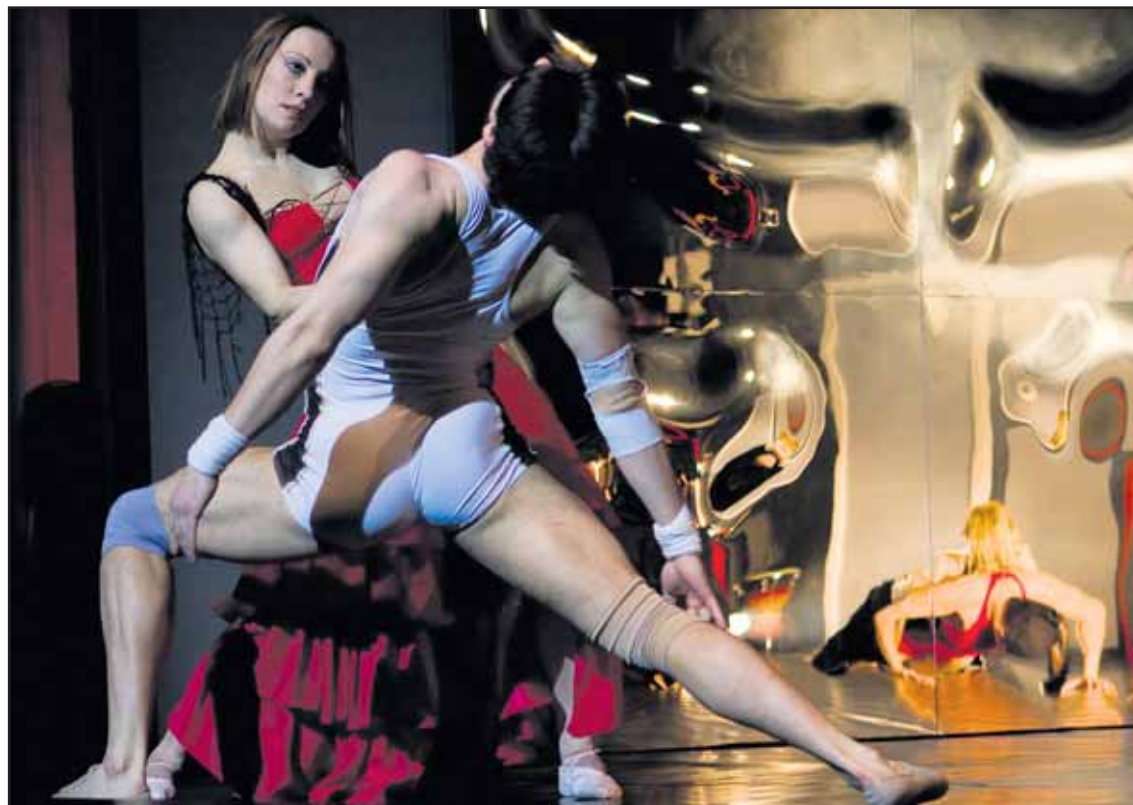
Tanečné divadlo uviedlo príbeh o láske, napätí, radosti, potešení, ale aj o bóli.

Výstava potrvá do 31. marca 2009 a je pre verejnosť prístupná denne od 10.00 do 16.00 h, počas víkendov od 10.00 do 15.00 h. Vstupné na výstavu je 1,33 €, zľavnené vstupné 0,66 €. (dš)