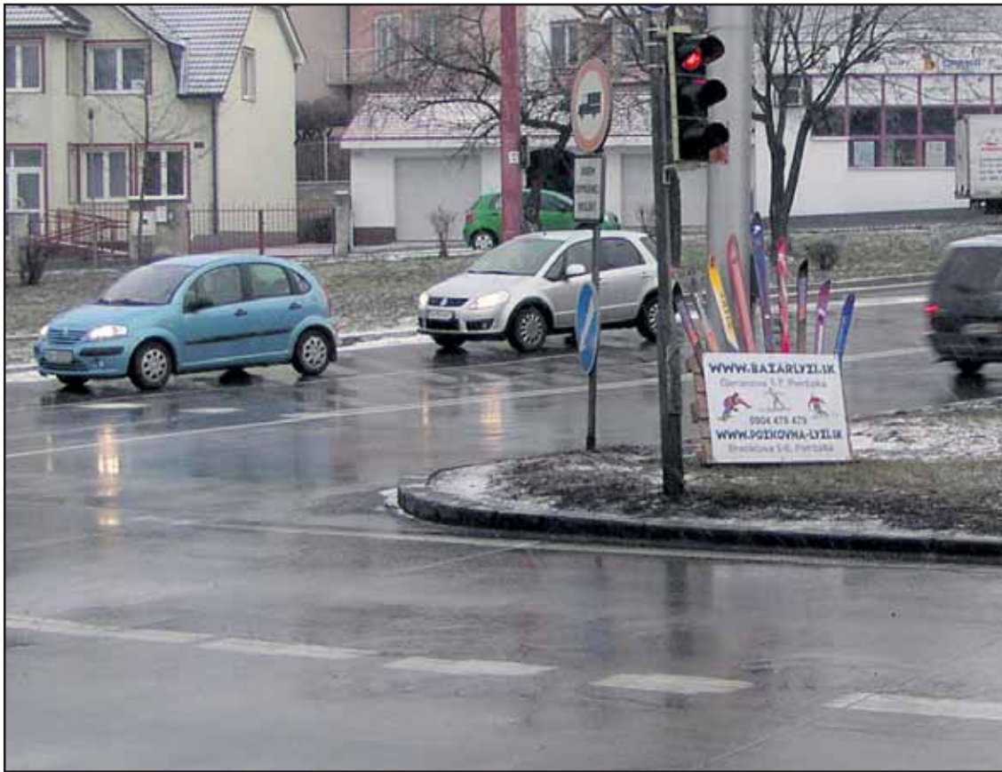
Reklama z paliet na bazar lyží tvorí súčasť križovatky na Patrónke.

Plesová sezóna sa v Bratislave začala 10. januára 2009. Podľa nášho zoznamu tento rok v Bratislave bolo či ešte bude 55 plesov a bálav. (brn)