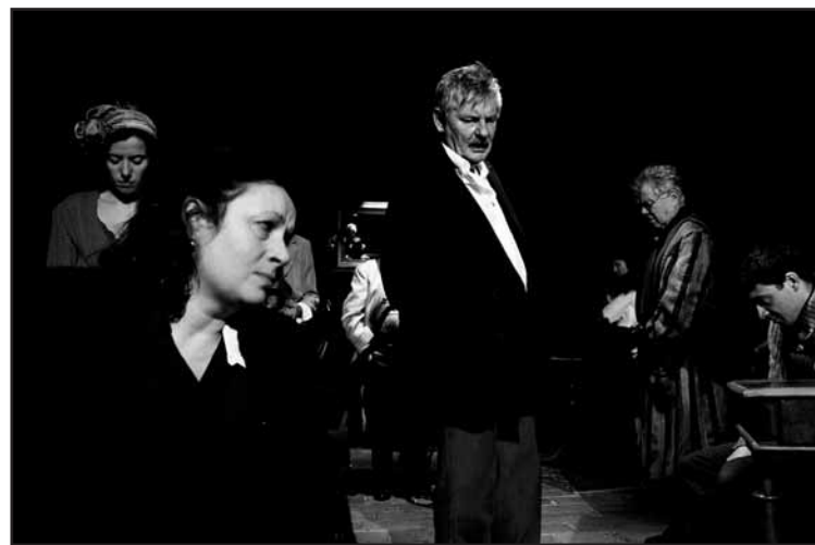
Bukovčanova hra je aj po rokoch dôvodom na zamyslenie, ako by sa človek zachoval v krízových momentoch.