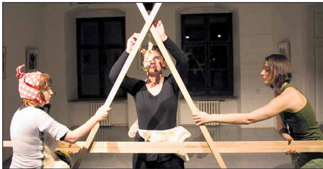
Druhé kolo je dielom, ktoré určite zaujme. Už tým, že je iné.