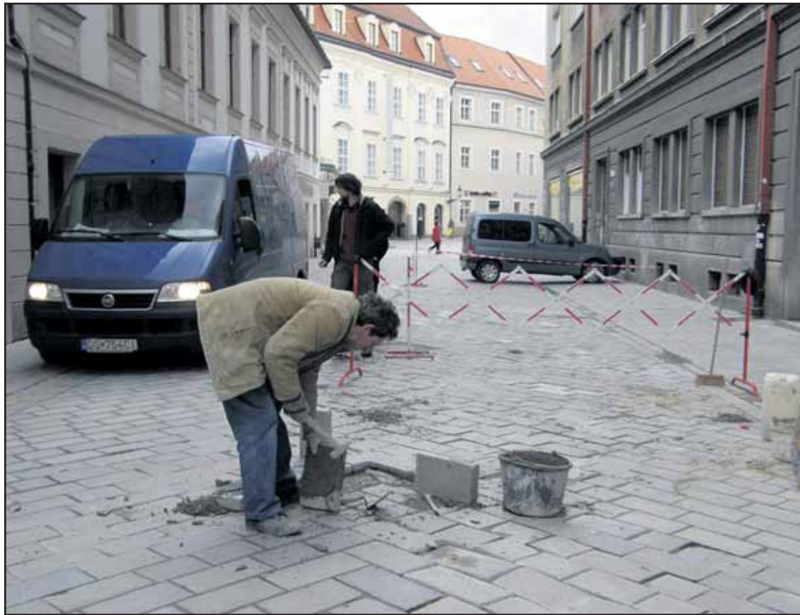
Bratislavská pešia zóna - zničená dlažba a počas celého dňa jazdiace autá.

Nová anketová otázka znie: Myslíte si, že Starý most bude opravený do novembra 2010, ako to sľúbil primátor mesta? Hlasovať môžete od 10. marca 2009 na www.banoviny.sk. (brn)