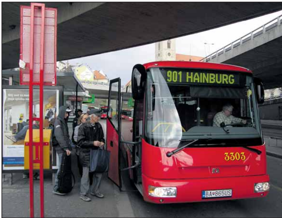
Kto chce ísť linkou 901 do Rakúska, musí si zobrať aspoň jeden doklad totožnosti.

Z celkového počtu oprávnených voličov, ktorých bolo v bratislavskom volebnom obvode 380 769, sa na prvom kole prezidentských volieb zúčastnilo 184 636 voličov, pričom bolo odovzdaných 183 419 platných hlasov. Do 2. kola prezidentských volieb postúpil Ivan Gašparovič a Iveta Radičová. Druhé kolo voľby hlavy štátu bude v sobotu 4. apríla 2009 od 7:00 do 22:00 h. (red)