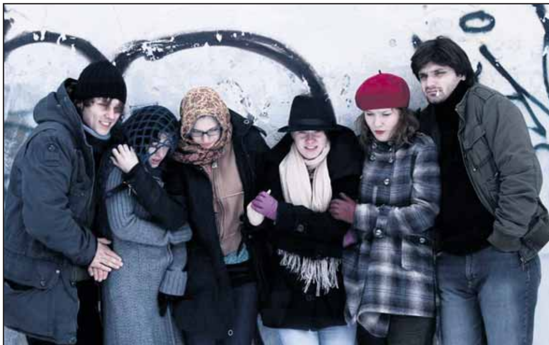
Fassbinderovu hru zobrali herci citlivo, ale najmä s pochopením.