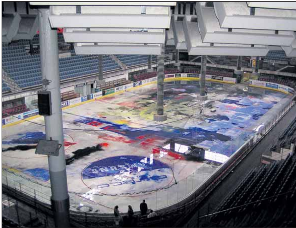
Jeden z posledných pohľadov do vnútra Zimného štadióna Ondreja Nepelu.

Keďže zodpovednosť za búranie PKO nesie primátor hlavného mesta, je otázne, či mestskí poslanci prevezmú na seba zodpovednosť za náhradu za budovu PKO, ktoré sú podľa všetkého definitívne odsúdené na zánik. (pol)