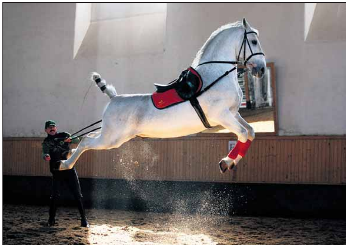
Jedna z fotografií, ktoré na výstave zaujmú, je od mladej fotografky Petry Áčovej.