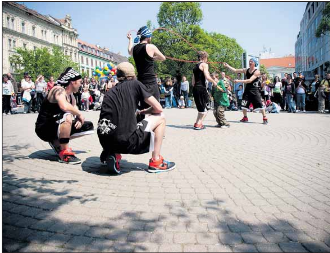
Centrum Bratislavy počas prvého májového víkendového oživilo aj vystúpenia pouličných umelcov.

Na mieste je otázka, prečo pán primátor a súčasné vedenie mesta vôbec neuvažujú o prevádzkovaní Starej tržnice v režii magistrátu. Vianočné, veľkonočné či letné trhy na Hlavom námestí organizuje samospráva mesta bez problémov, prečo by teda nezvládla prevádzkovať Starú tržnicu? Doteraz sa totiž o to ani nepokúsila. (pol)