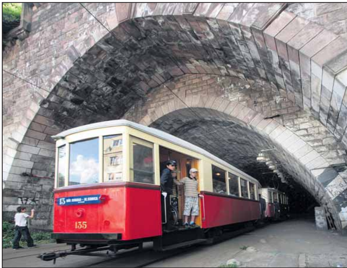
Jedna z posledných električiek, ktoré prešli tunelom. Ďalšie ním prejdú najskôr až o rok.

Yeti bude hosťom na výstave Šangri-la - India - Tibet - Nepál v Slovenskom národnom múzeu (Prírodovedecké múzeum). Ryžovanie zlata môže zaujať v Múzeu Maďarov na Slovensku. Nádvorie Bratislavského hradu sprístupnia pracovníci Historického múzea a kto sú „talenty v Bašte“ prezradia v Hudobnom múzeu. (mm)